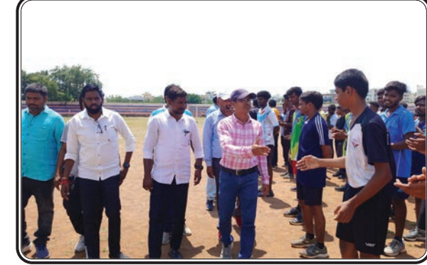
కరీంనగర్ టౌన్, సెప్టెంబర్ 30, ప్రజాజ్యోతి.