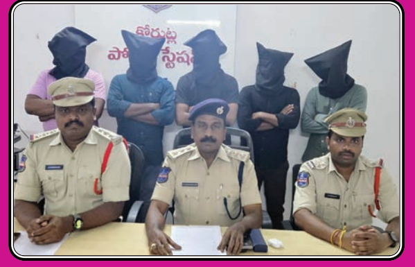
కోరుట్ల, అక్టోబర్ 17, ప్రజాజ్యోతి

- అదుపులో ఐదుగురు నిందితులు... - పరారీలో ఒక నిందితుడు - ఒక కత్తి, నాలుగు సెల్ ఫోన్లు, రెండు బైకులు స్వాధీనం - వివరాలు వెల్లడించిన డిఎస్పి ఉమామహేశ్వరరావు