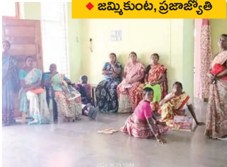
◆ జమ్మికుంట, ప్రజాజ్యోతి