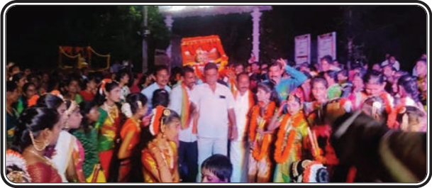
హుజురాబాద్, అక్టోబర్ 17, ప్రజాజ్యోతి