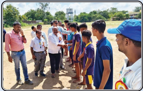
సుల్తానాబాద్, అక్టోబర్ 17, ప్రజాజ్యోతి