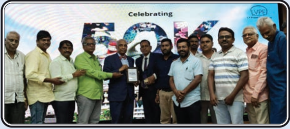
జమ్మికుంట, అక్టోబర్ 17 (ప్రజాజ్యోతి):

ఎల్ వి ప్రసాద్ కంటి ఆసుపత్రి నుండి ఆహ్వానం తరలివెళ్లిన సదాశయ ఫౌండేషన్ సభ్యులునేత్ర దానం పై అవగాహన కల్పించడం పై ప్రశంసా పత్రాలు