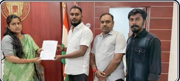
ప్రజాజ్యోతి కరీంనగర్ బ్యూరో: