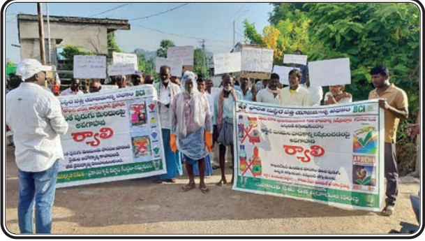
సైదాపూర్ అక్టోబర్ 17 (ప్రజాజ్యోతి)

సైదాపూర్ మండలంలోని రామాచంద్రపూర్ గ్రామంలో గ్రామ రైతులకు డబ్బూ, డబ్బూ, ఎఫ్ - నవ క్రాంతి రైతు ఉత్పత్తిదారుల సంస్థ వారి బి. సి. ఐ ప్రాజెక్టు ఆధ్వర్యంలో రైతులతో ర్యాల్లీ ఏర్పాటు చేయడం జరిగింది. పురుగుమందులు పిచికారి చేసేటప్పుడు తప్పక రక్షణ దుస్తులు (పి. పి. ఈ ) ధరించాలని, ప్రమాదవ శాస్త్ర పురుగు మందు శరీరం పై పడినట్లయితే ఈ మందు మన శరీరంలోకి ప్రవేశించే ఆస్కారం ఉంది. ఈ మందు జననోద్రియాల నుండి 100% శరీరంలోకి వెళ్లే ఆస్కారం ఉంది. దీని వల్ల మనుషులకు రకరకాల జబ్బులు, చర్మ రోగాలు, క్యాన్సర్లు వచ్చే అవకాశం ఉంటుంది. అందుచేత రక్షణ దుస్తులు అనగా ముఖానికి మాస్క్, తలకి హెల్మెట్, శరీరాన్ని పూర్తిగా కప్పి ఉంచే దుస్తులు, కళ్ళకి అద్దాలు, చేతులకు గ్లోబులు, కాళ్ళకి బూట్లు వేసుకొని స్పే చేయాలని, అలాగే ఎరువు రంగు గుర్తు కలిగినటువంటి మోనో ఇతర మందులు వాడారని, పురుగు మందులు