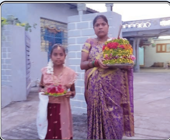
జగిత్యాల, అక్టోబర్ 14, ప్రజాజ్యోతి

రాయికల్ మండలం సింగరావుపేట గ్రామంలో బతుకమ్మ సందర్భంగా గౌరవ మునుపసుపు రంగు పూలతో పేర్చి తొమ్మిది రోజులపాటు ఆటపాటలాడితొమ్మిది రోజుల పాటు కొనసాగే బతుకమ్మలను చెరువులో లేదా నీటి నదీ ప్రవాహంలో నిమజ్జనం చేస్తారు. బతుకమ్మ బతుకమ్మ ఉయ్యాలలో అని సాగే ఈ పాటల్లో మహిళలు తమ కష్టసుఖాలు, ప్రేమ, స్నేహం, బంధుత్వం, ఆప్యాయతలు, భక్తి, భయం, చరిత్ర, పురాణాలు మేళవిస్తారు. బతుకమ్మ పాటలు చాలా వినసాంపుగా ఉంటాయి. తెలంగాణ సంస్కృతి, సంప్రదాయాలకు ప్రతీక ఈ బతుకమ్మ పండుగ, తెలంగాణ అస్పృశ్య బతుకమ్మలోనే ఉంది. తెలంగాణ నేలపై బతుకమ్మ పండుగను శతాబ్దాలుగా జరుపుకుంటున్నారు.