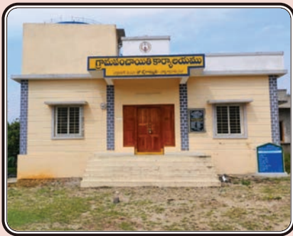
బూర్గంపహాడ్, అక్టోబర్ 14, ప్రజాజ్యోతి