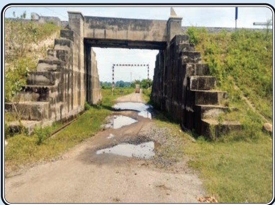
చంద్రగొండ, అక్టోబర్ 14, ప్రజాజ్యోతి

ఏళ్ల తరబడి అదే దుస్థితి... పాదచారులకు, వాహనదారులకు తప్పనికష్టాలు... పట్టించుకునే నాధుడేడి అంటూ ప్రజల ఆవేదన... చంద్రగొండ మండల పరిధిలోని గుర్రాయ గూడెంకు వెళ్లే ఆర్ అండ్ బి రోడ్డు సీతారామ ప్రాజెక్టు పనులు నడిచే సమయంలో భారీ వాహనాలు వెళ్లడంతో రోడ్డు మొత్తం గుంతలు తేలి చిన్నపాటి వర్షానికి నీళ్లు నిలిచి తీవ్ర అసౌకర్యానికి గురి చేస్తూ వాహనదారులకు పాదచారులకు చుక్కలు చూపిస్తుండటంలో సందేహం లేదు. ఇది ఇప్పటి సమస్య కాదు సుమారు నాలుగు ఐదు సంవత్సరాల క్రితం నుండి ఇదే పరిస్థితి అధికారులు వస్తున్నారు. ప్రజాప్రతినిధులు చూస్తున్నారు. సమస్య మాత్రం తీరటం లేదు. దీనికి తోడు రైల్వే అండర్ బ్రిడ్జి కింద నీళ్లు నిలిచి ఉండటంతో రాత్రి వేళల్లో వాహనదారులు తీవ్ర ఇబ్బందులు గురై క్షతగాత్రులైన సందర్భాలు ఉన్నాయి. ప్రస్తుత ఎమ్మెల్యే జారే ఆదినారాయణ నియోజకవర్గ వ్యాప్తంగా అభివృద్ధి చేస్తూ ప్రజల ఆదరాభిమానాలు పొందుతున్న వేళ ఈ సమస్య ఆయన దృష్టికి వెళ్లితే ఇట్టే పరిష్కారం అవుతుందని కంపెనాశతో ఇరు గ్రామాల ప్రజలు ఎదురుచూస్తున్నారు. ఈ విషయంలో ఎమ్మెల్యే జారే ఆదినారాయణ సమస్య పరిష్కరిస్తారని ఆశతో చంద్రగొండ, గుర్రాయ గూడెం ప్రజలు గంపెడు ఆశలు పెట్టుకున్నారు.