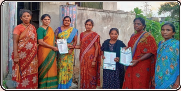
బూర్గంపహాడ్, అక్టోబర్ 14