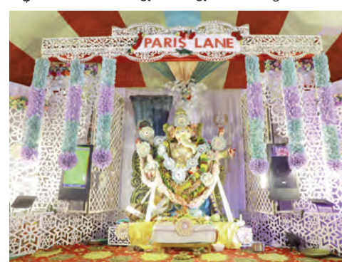
మా పుత్ర కమిటీ సభ్యులు ఉన్నారు.

శివలింగం ఏర్పాటు చేయడం జరిగిందని అక్షయ చాలామంది సెల్ఫీ ఫోటోలు దిగుతున్నారని అన్నారు. ఈ కార్యక్రమంలో ఉ