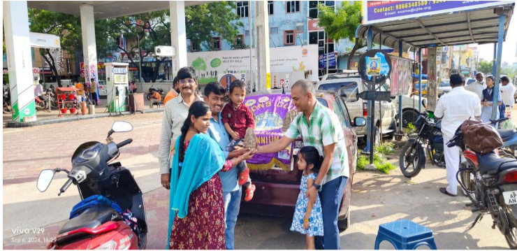
గణపతిని నిమర్షనం చేయడం వలన జలవనరులు కాలుష్యానికి గురికావడం జరుగుతుందని, వీటి వలన జల వనరుల నాణ్యత తగ్గడంతో పాటు వృక్ష, జంతు జీవాలపై ప్రభావం కలుగుతుందన్నారు.