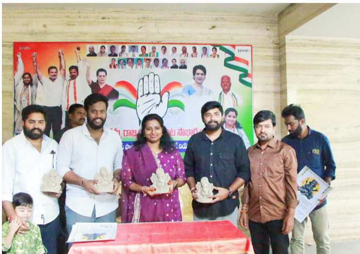
కోసం మట్టి గణపతులనే ప్రతిష్టించాలని హితవు పలికారు.

హనుమకొండ జిల్లా ప్రతినిధి: సెప్టెంబర్ 05, ప్రజా జ్యోతి.: జల వనరులతో పాటు పర్యావరణం కలుషితం కాకుండా ఉండాలంటే ప్రతీ ఒక్కరూ మట్టి గణపతులనే పూజించాలని వరంగల్ పార్లమెంట్ సభ్యురాలు డాక్టర్ కడియం కావ్య అన్నారు. ప్రపంచ పర్యావరణ సంస్థ ఆధ్వర్యంలో మట్టి గణపతుల పంపిణి కార్యక్రమం వాల్ పోస్టర్ ను హనుమకొండ కనకదుర్గ కాలనీలోని ఎంపీ నివాసంలో ఎంపీ డాక్టర్ కడియం కావ్య ఆవిష్కరించారు. ఈ సందర్భంగా ఎంపీ మాట్లాడుతూ పర్యావరణాన్ని పరిరక్షించడం ప్రతి ఒక్కరి బాధ్యత అని గుర్తు చేశారు. ప్లాస్టర్ ఆఫ్ ప్యారిస్ తో కూడిన విగ్రహాల వల్ల పర్యావరణానికి హాని చేకూరుతుందని, విగ్రహాలను నిమజ్జనం చేస్తే నీరు కలుషితం అవుతుందన్నారు. దీనిని దృష్టిలో పెట్టుకుని ప్రపంచ పర్యావరణ సంస్థ క్రమం తప్పకుండా మట్టి విగ్రహాలను రూపొందిస్తూ ప్రజలకు పంపిణి చేస్తుండడం అభినందనీయమన్నారు. ప్రజలు కూడా పర్యావరణ హితం