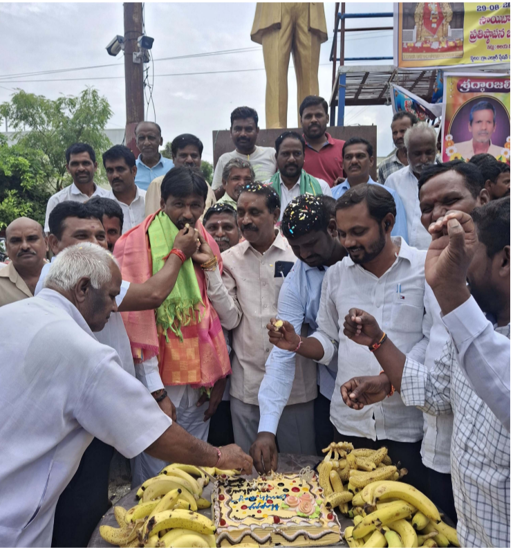
సంగం, సెప్టెంబర్ 05 (ప్రజాజ్యోతి): సంగం మండల కాంగ్రెస్ పార్టీ

-కేక్ కట్ చేసి బాణాసంచా కాల్చి స్వీట్లు పండ్లు పంపిణీ చేసిన కాంగ్రెస్ నాయకులు