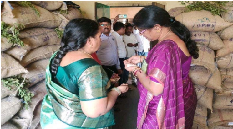
వ్యక్తిగత పరిశుభ్రతతో పాటు పరిసరాల పరిశుభ్రతను పాటించాలి.