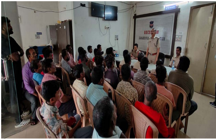
పెట్టవద్దని, ఇతర ఇతర విగ్రహ మండప నిర్వాహకులతో గొడవలు పెట్టుకోవద్దని, ఎటువంటి చిన్న సమస్య తలెత్తిన వెంటనే పోలీసులకు తెలియజేయాలని తెలిపినారు.