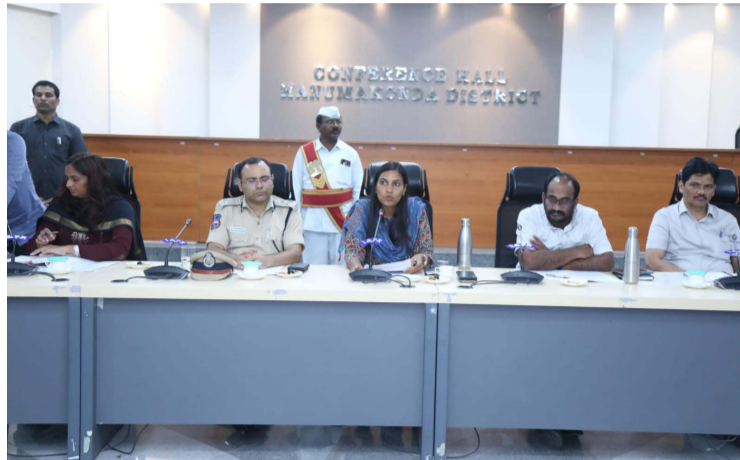
ప్రశాంత వాతావరణంలో గణేష్ ఉత్సవాలు నిర్వహించుకోవాలి..