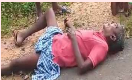
బేకుమట్ల సెప్టెంబర్ 26 ప్రజాజ్యోతిస్వ్యాంస్ :