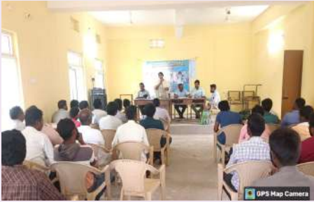
చిట్టాల ( ప్రజాజ్యోతి) సెప్టెంబర్ 26 :