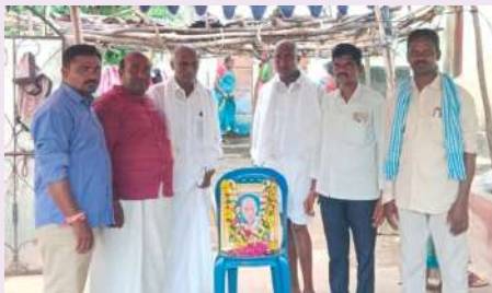
బీకుమట్ల సెప్టెంబర్ 26 ప్రజాజ్యోతిస్వయం :