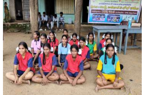
జరుగుతుందని తెలిపారు. మండల స్థాయి క్రీడోత్సవాలలో గెలుపొందిన విద్యార్థిని విద్యార్థులకు ఉపాధ్యాయులు మరియు వారి వారి పాఠశాల ఉపాధ్యాయ బృందం తోటి మిత్రులు కృతజ్ఞతలు తెలియజేశారు.