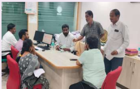
పర్చస్మేట్ సెప్టెంబర్ 26 (ప్రజా జ్యోతి):

- టెన్సాల్ వైర్లెస్ మార్కెసి రవీందర్ రావు