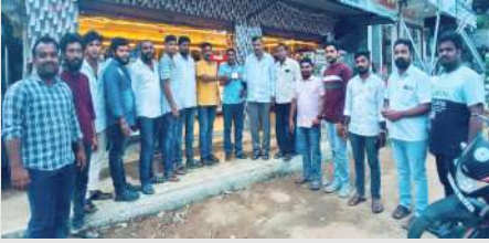
తొర్రూరు , సెప్టెంబర్ 25 ( ప్రజా జ్యోతి ):