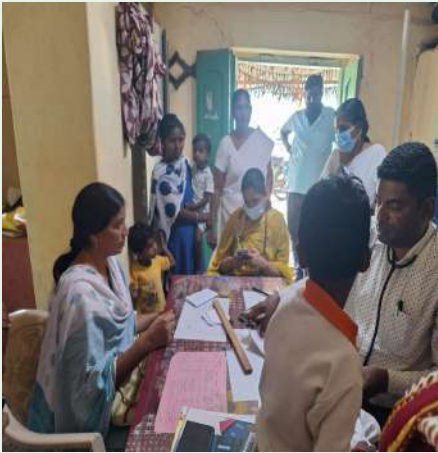
ఆత్మకూర్, సెప్టెంబర్ 25, ప్రజా జ్యోతి :