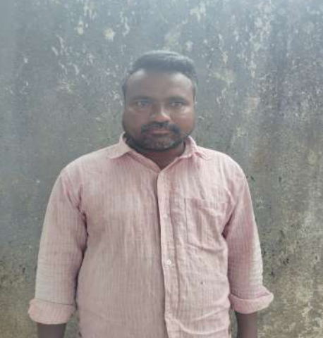
ఇబ్బందులు ఎదురుంటున్నాయి.ఇప్పటికైనా అధికారులు స్పందించి పనులు పూర్తి చేయాలి