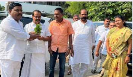
హనుమకొండ జిల్లా ప్రతినిధి: సెప్టెంబర్ 22, ప్రజా జ్యోతి :