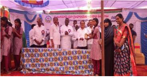
-ప్రజా గ్రంథాలయం విద్యార్థులకు వరం లాంటిది