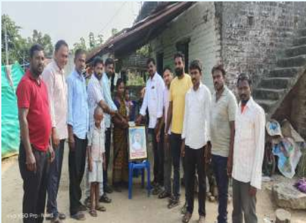
సర్పంచలపేట సెప్టెంబర్ 23 (ప్రజా జ్యోతి) :

-రూ.20,000లు ఆర్థిక సహాయం అందజేసిన తోటి స్నేహితులు