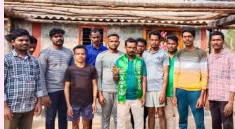
వెంకటాపురం సెప్టెంబర్ 19 (ప్రజాజ్యోతి) :