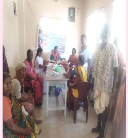
భీమదేవరపల్లి సెప్టెంబర్ 19, (ప్రజా జ్యోతి) :

-చంటయ్యపల్లి, వంగర గ్రామాల్లో వైద్య శిబిరాలు