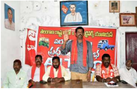
- తెలంగాణ రాష్ట్ర ఆటో-ట్రాలీ డ్రైవర్స్ యూనియన్ వరంగల్ జిల్లా ప్రధమ మహాసభ - సెప్టెంబర్ 22,23 తేదీల్లో జరిగే రాష్ట్ర మహాసభలను జయప్రదం చేయండి వరంగల్ సీటీ, సెప్టెంబర్ 19 (ప్రజాజ్యోతి):