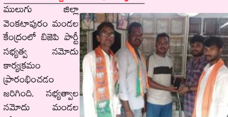
వెంకటాపురం సెప్టెంబర్ 19 (ప్రజాజ్యోతి) :