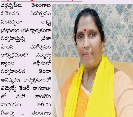
పర్లన్నపేట సెప్టెంబర్ 18 (ప్రజా జ్యోతి):