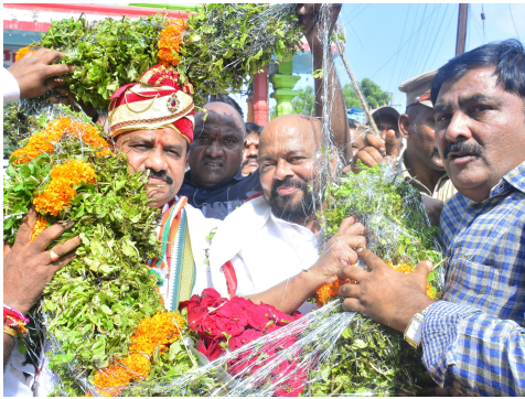
వరంగల్ నీటి, సెప్టెంబర్ 18 (ప్రజాజ్యోతి):