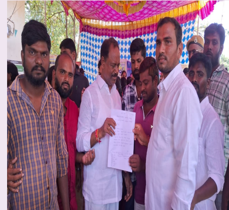
శాయంపేట సెప్టెంబర్ 18 ప్రజా జ్యోతి :