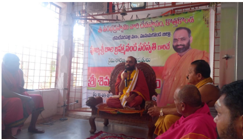
భీమచేరపల్లి సెప్టెంబర్ 18 ప్రజా జ్యోతి