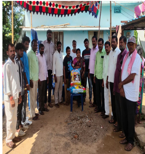
గుడూరు సెప్టెంబర్ 18 (ప్రజాజ్యోతి)