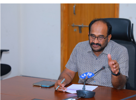
-రాజకీయ పార్టీల ప్రతినిధులతో సమావేశం.