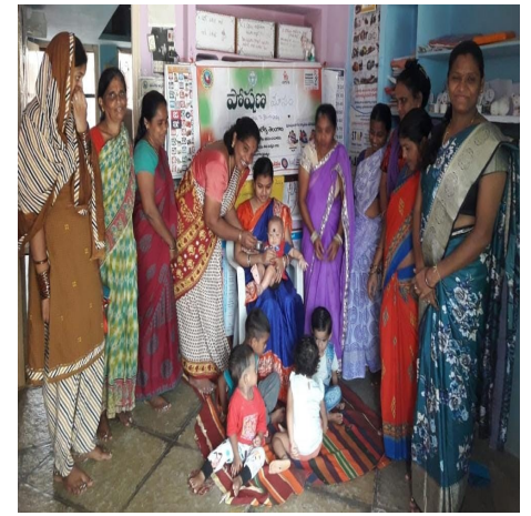
పరంగల్ సీటీ, సెప్టెంబర్ 18 (ప్రజాజ్యోతి):