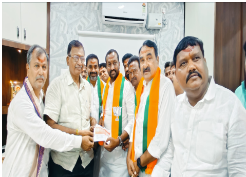
- మెడక్ పార్లమెంట్ సభ్యులు రఘునందన్ రావు