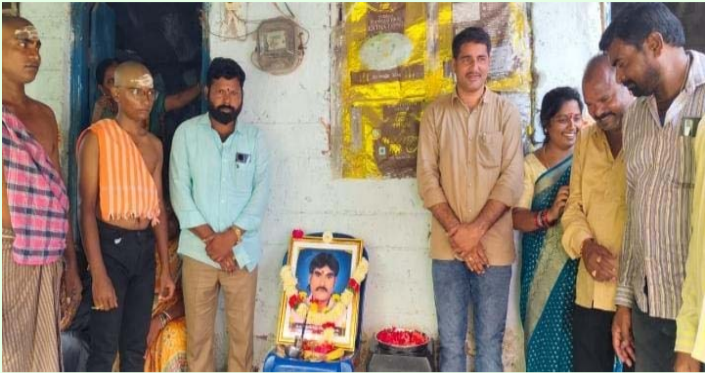
గూడూరు(ప్రజా జ్యోతి) సెప్టెంబర్ 12 :