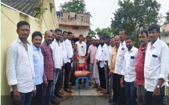
మహబూబాబాద్ జిల్లా (ప్రజా జ్యోతి)12 సెప్టెంబర్