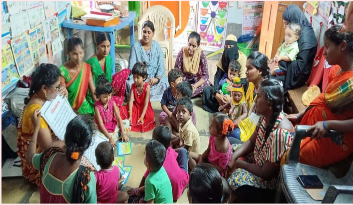
రఘునాథపల్లి, సెప్టెంబర్ 10 (ప్రజాజ్యోతి)