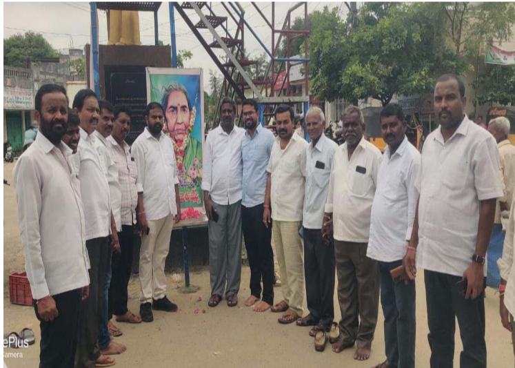
-తెలంగాణ సాయుధ పోరాటంలో చాకలి ఐలమ్మ ఓ నిపురవ్వ..