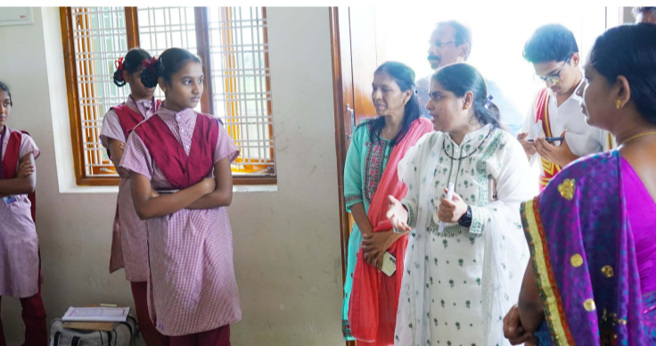
-విద్యార్థులు ఎలాంటి అనారోగ్యాలకు గురి కాకుండా చూసుకోవాలి

-సీజనల్ వ్యాధులు ప్రభలకుండా చూసుకోవాలి -అధికారులకు అదేశించిన జిల్లా కలెక్టర్