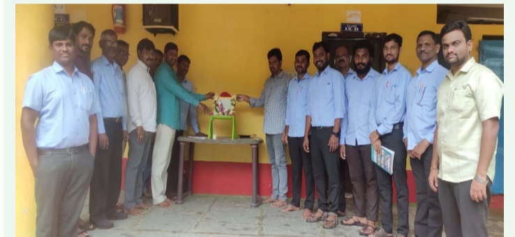
కేసముద్రం, సెప్టెంబర్ 09 (ప్రజాజ్యోతి):