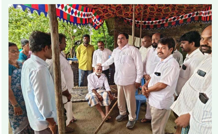
రాయపర్తి మండలం, సెప్టెంబర్ 9 ప్రజా జ్యోతి: