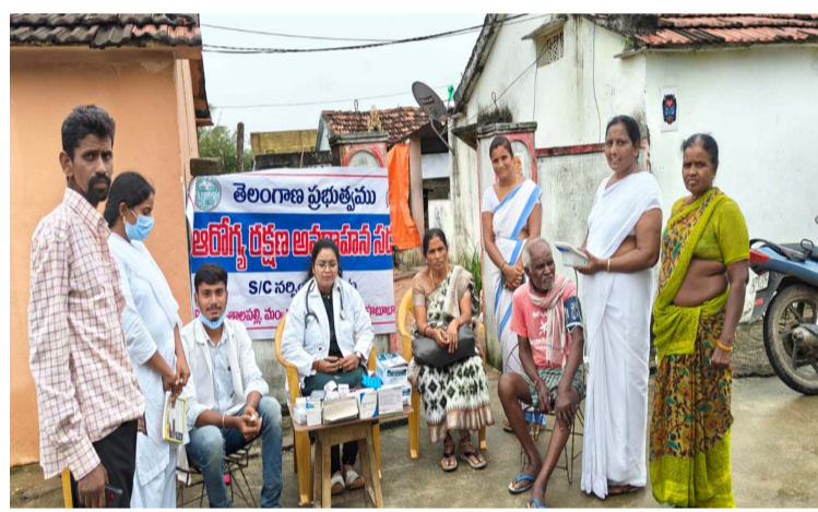
-ఎస్సీ కాలనీలో మెడికల్ క్యాంపు నిర్వహణ సరసించులపేట సెప్టెంబర్ 9 (ప్రజా జ్యోతి)

గత వారం రోజులుగా ఎడతెరిపి లేకుండా కురుస్తున్న వానలకి విష జ్వరాలు ప్రబలడంతో సరసించుల పేట మండల కేంద్రంలోని ఎస్సీ కాలనీలో మెడికల్ క్యాంపు నిర్వహించిన స్థానిక పల్లె దావకాన సిబ్బంది. మహబూబాబాద్ జిల్లా వ్యాప్తంగా గత వారం రోజులుగా ఎడతెరిపి లేకుండా వానలు కురవడంతో సరసించుల పేట ఎస్సీ కాలనీలో దోమల బెడద ఎక్కువ ఉండటం వల్ల విష జ్వరాలు ప్రబలి పలువురు అనారోగ్యం పాలయ్యారు ఈ మేరకు సమాచారం అందుకున్న స్థానిక పల్లె దావకాన సిబ్బంది ఎస్సీ కాలనీలో మెడికల్ క్యాంపు నిర్వహించాలని దంతాలపల్లి మెడికల్ అధికారి సూచనల మేరకు మెడికల్ క్యాంపులు నిర్వహించడం జరిగింది. ఈ క్యాంపులో భాగంగా సుమారు 76 మందికి బిపి, షుగర్, డెంగ్యూ మలేరియా టైఫాయిడ్ టెస్ట్ చేయగా అందరికీ నెగిటివ్ రాగా నలుగురికి వైరల్ ఫీవర్, ముగ్గురికి బిపి, కీళ్ల నొప్పులు గా తేలింది ఆ యొక్క జ్వరాలకు సంబంధించిన మెడిసిన్ మెడికల్