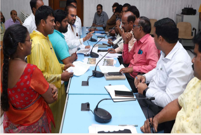
పరంగల్ సీటీ, సెప్టెంబర్ 09 (ప్రజాజ్యోతి):

- ప్రజల నుండి విజ్ఞప్తులు స్వీకరించిన అదనపు కమీషనర్, అధికారులు