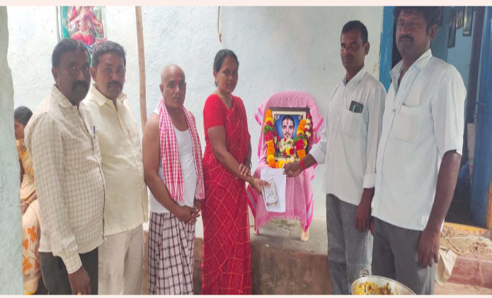
కొడకండ్ల / జనగామ, సెప్టెంబర్ 09 (ప్రజాజ్యోతి) :