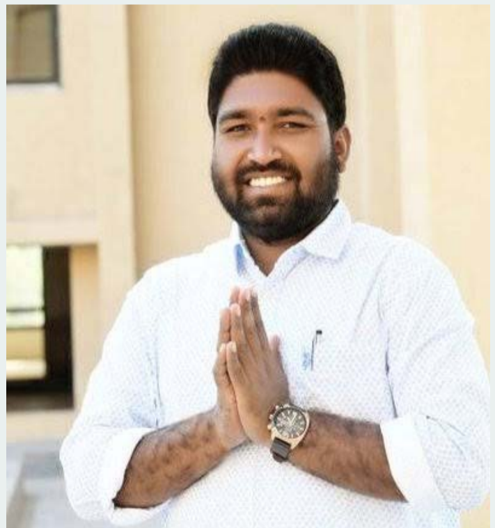
వరంగల్ సిటీ, సెప్టెంబర్ 09 (ప్రజాజ్యోతి):