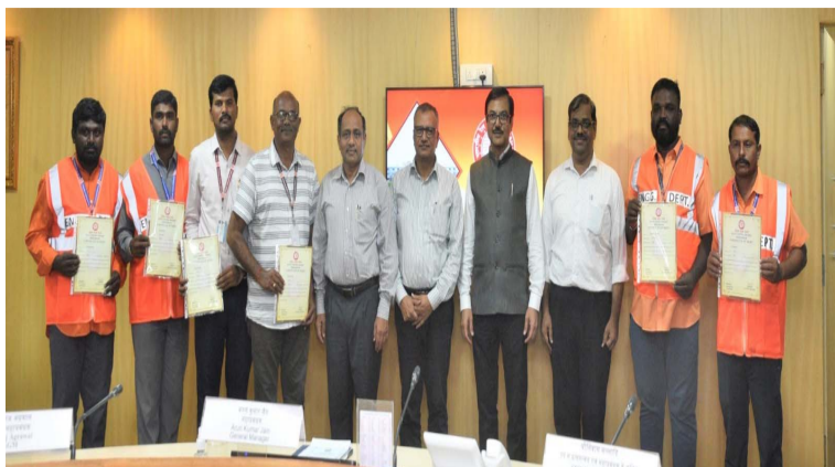
-విధినిర్వహణలో అంకితభావం... భారీ ప్రమాదాన్ని నిలువరించింది

-భారీ వర్షాల సమయంలో సకాలంలో దెబ్బ తిన్న ట్రాక్లను గుర్తించిన