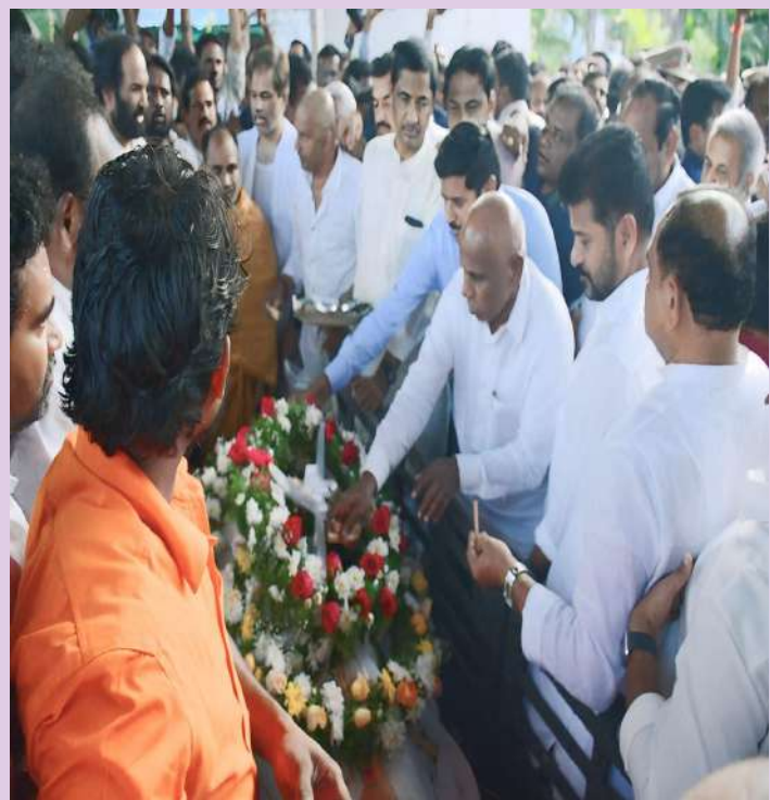
చేవెళ్ల సెప్టెంబర్ 29(ప్రజా జ్యోతి):