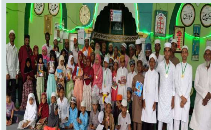
కొడంగల్ సెప్టెంబర్ 29 ప్రజా జ్యోతి న్యూస్