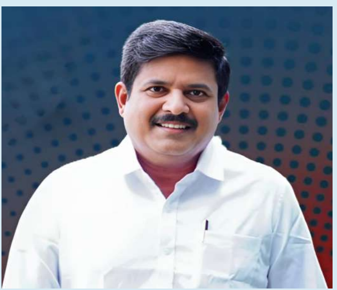
తాండూర్ సెప్టెంబర్ 29 ప్రజా జ్యోతి:-