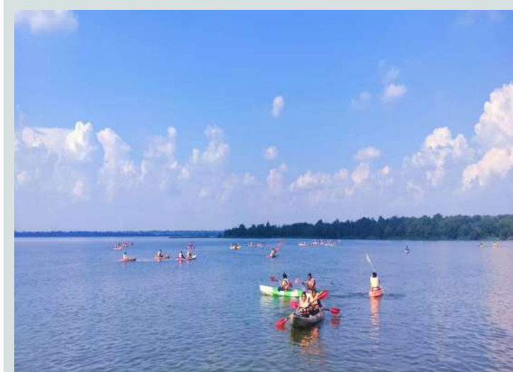
ధారుర్ సెప్టెంబర్ 29 (ప్రజా జ్యోతి)

ఆదివారం సెలవు దినం కావడంతో మండల పరిధిలోని కోట్ పల్లి ప్రాజెక్ట్ కు వివిధ ప్రాంతాల నుండి పర్యాటకులు పెద్ద ఎత్తున వచ్చి ప్రకృతి అందాలను వీక్షిస్తూ ప్రాజెక్ట్ లో కయా కింగ్ వారు ఏర్పాటు చేసిన బోటింగ్ చేస్తూ ఎంజాయ్ చేశారు.మరి కొంతమంది పర్యాటకులు కుటుంబ సభ్యులతో కలిసి వనభోజనాలు చేస్తూ ఎంజాయ్ చేశారు.