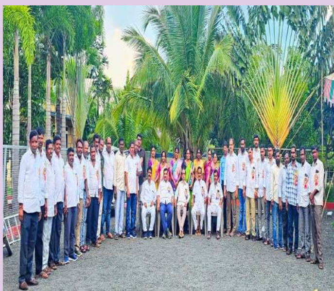
చేవెళ్ల సెప్టెంబర్ 29(ప్రజా జ్యోతి):

- 25 సంవత్సరాల తర్వాత కలుసుకున్న చన్నెల్లి జిల్లా పరిషత్ పదవ తరగతి విద్యార్థులు