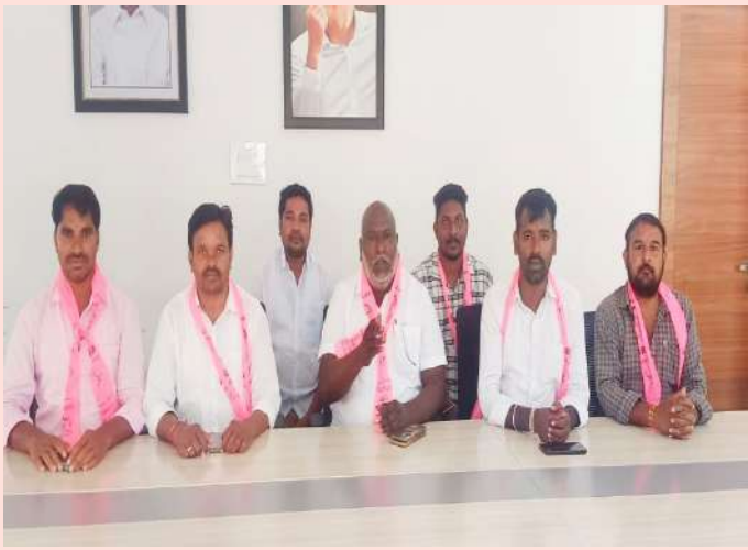
చిన్నకోడూర్, సెప్టెంబర్ 29 (ప్రజా జ్యోతి):