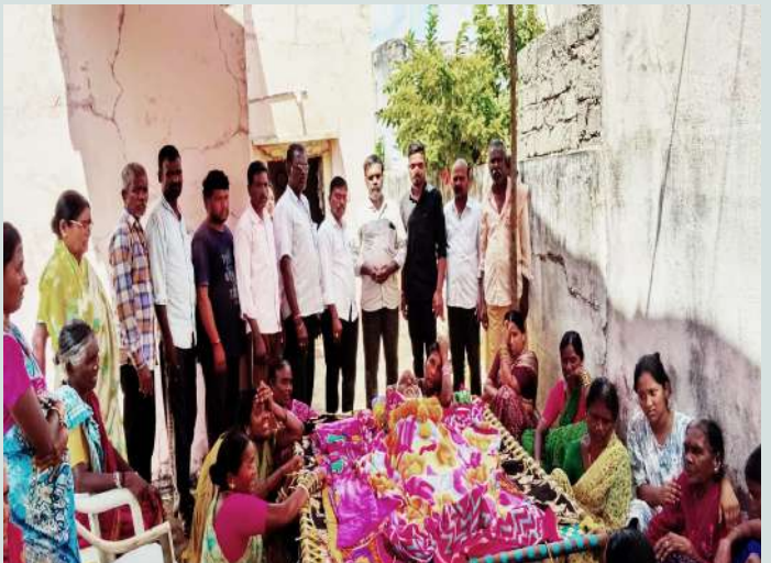
(ప్రజా జ్యోతి సెప్టెంబర్ 28/ తలకొండపల్లి)