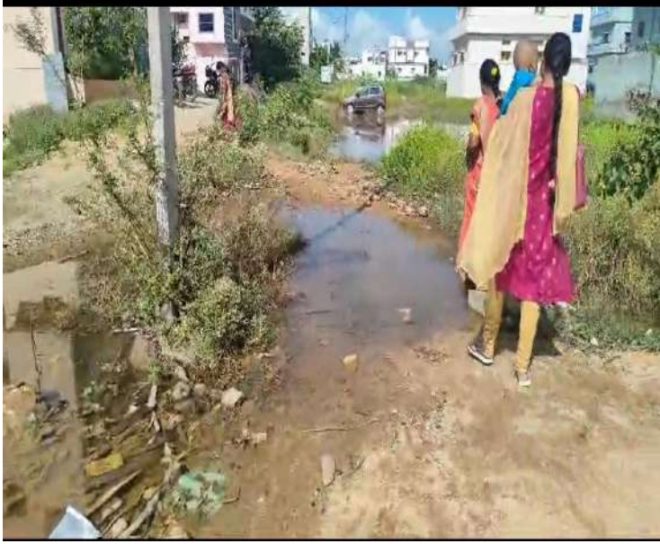
-మురుగునీరు వెళ్లడానికి మార్గం ఏర్పాటు చేయండి మహాప్రభు అంటున్న కాలనీవాసులు

అలంపూర్ డివిజన్ (ప్రజాజ్యోతి) సెప్టెంబర్ 28: జోగులాంబ గద్వాల జిల్లా ఎర్రవల్లి మండల కేంద్రంలో మురుగునీరు చేరి తీవ్రమైన ఇబ్బందులకు గురవుతున్న సాయి నగర్ కాలనీవాసులు పట్టించుకోని అధికారులు. ప్రజాప్రతినిధులు తీవ్రమైన అనారోగ్యాలకు గురవుతున్న ప్రజలు మా బాధ మాత్రం ఎవరికీ అర్థం కావడం లేదు అని అంటున్న ఎర్రవల్లి సాయి నగర్ కాలనీ వాసులు. ఎక్కడ చెరువు కాదు ఇది మన ఎర్రవల్లి సాయి నగర్ కాలనీ ఎర్రవల్లిలో ఒక ద్వీపంలా చుట్టూ ముట్టి చుట్టుపక్కల ఇళ్ల వాళ్ళు కనీసం వాళ్ల ఇంటికి వెళ్లడానికి నడకదారి కూడా లేకుండా తీవ్రమైన ఇబ్బందులు పడుతున్నారు. చుట్టూముట్టు ఒక ద్వీపంలా కనిపిస్తుంది. కాలినీ వాసులు చాలా రోగాలకు గురవుతున్నారు. అక్కడ దోమలు చేరి వివిధ రోగాలు వస్తున్నాయి అధికారులకు ప్రజా ప్రతినిధులకు ఎంతమందికి చెప్పిన నిమ్మకు నీరెత్తినట్లు పట్టించుకోకుండా ఉంటున్నారు. దాని వల్ల తీవ్రమైన ఇబ్బందులు ప్రజలు ఎదుర్కోవాల్సి వస్తుంది. మరి ఎందుకు ఇంత నిర్లక్ష్యం వ్యవహరిస్తున్నారు అర్థం కావడం లేదు ఈ మురికి నీరు