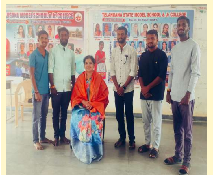
తాండూర్ సెప్టెంబర్ 28 ప్రజాజ్యోతి :-