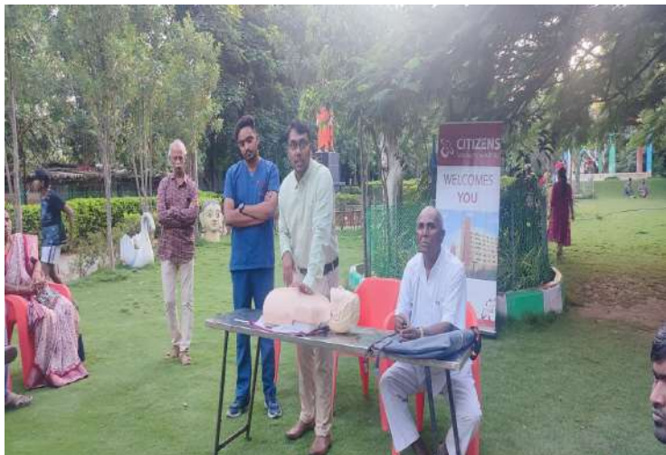
శేరిలింగంపల్లి, సెప్టెంబర్ 28 (ప్రజాజ్యోతి):