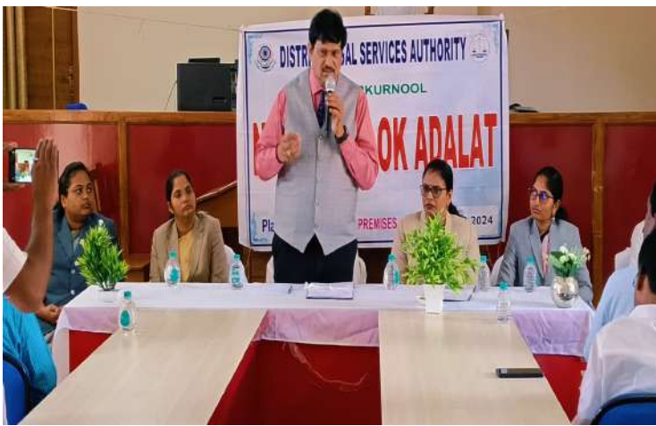
-ప్రధాన న్యాయమూర్తి డి రాజేష్ బాబు

-జిల్లా కోర్టు ప్రాంగణంలో న్యాయ విజ్ఞాన సదస్సు ఏర్పాటు