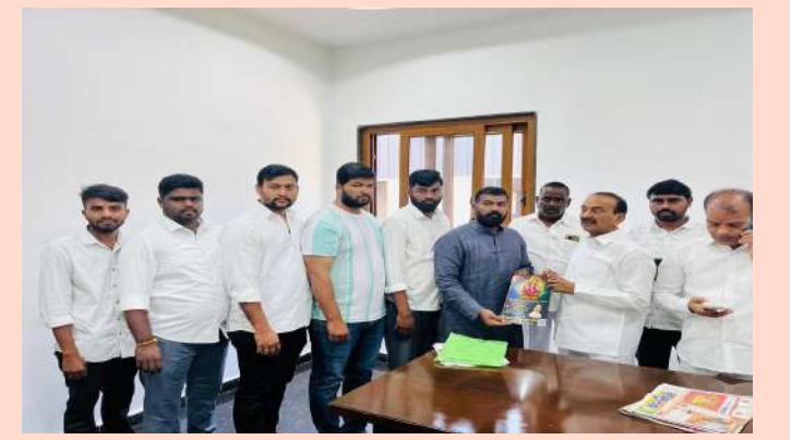
-అందజేసిన శ్రీ భవాని నవరాత్రి ఉత్సవ సమితి