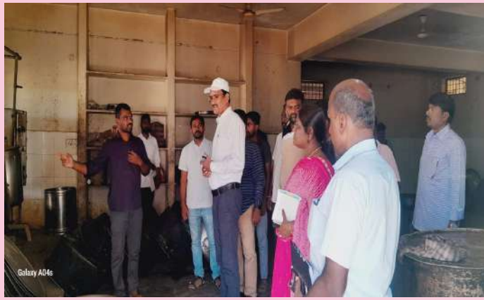
కోహడ, సెప్టెంబర్ 28 (ప్రజా జ్యోతి)

కోహడ మండల కేంద్రంలోని, సాంఘిక సంక్షేమ గురుకుల పాఠశాలను హుస్సాబాద్ రెవెన్యూ డివిజన్ అధికారి శనివారం ఆకస్మికంగా తనిఖీలు చేపట్టారు. సమస్యల్ని తెలుసుకొని, త్వరగా పరిష్కరించాలని సంబంధిత అధికారులకు ఆదేశించారు.