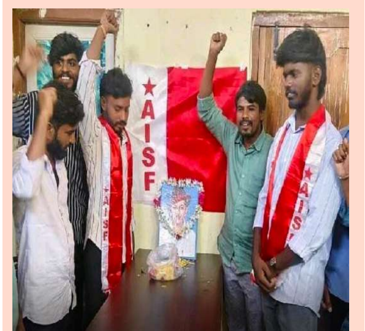
కల్వేర్ సెప్టెంబర్ 28 ప్రజాజ్యోతి