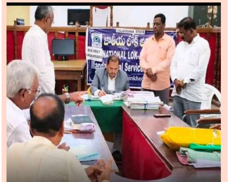
కల్వేర్ 28 సెప్టెంబర్ ప్రజాజ్యోతి