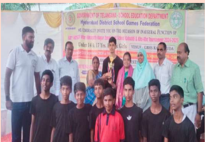
హైదరాబాద్, సెప్టెంబర్ 28 (ప్రజా జ్యోతి) :