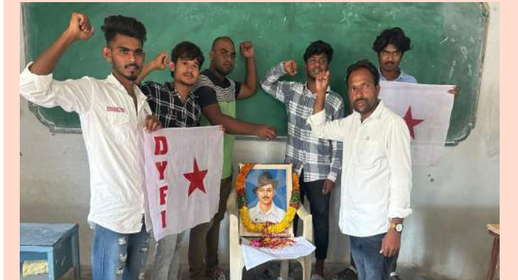
నాగర్ కర్నూల్ సెప్టెంబర్ 28 (ప్రజా జ్యోతి ప్రతినీధి)

-డివైఎఫ్ఐబి జిల్లా అధ్యక్షుడు వర్ధ0 సైదులు