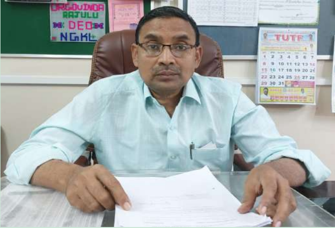
నాగర్ కర్నూల్, ప్రజా జ్యోతి 28 సెప్టెంబర్