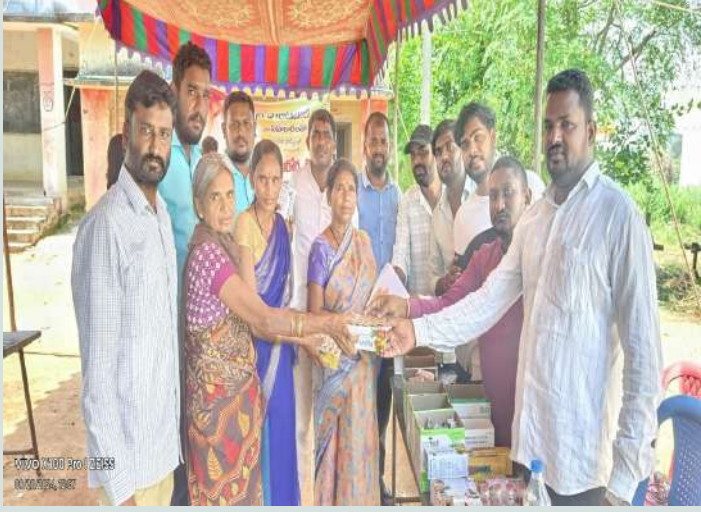
(ప్రజా జ్యోతి సెప్టెంబర్ 28/ తలకొండపల్లి)