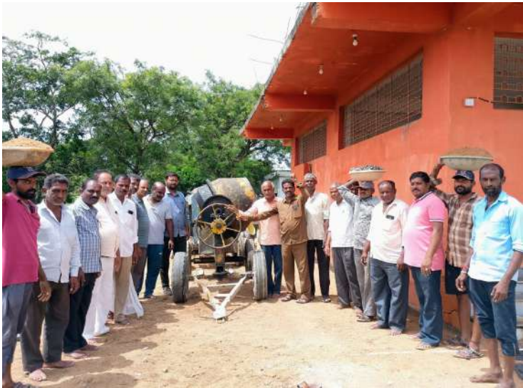
-నిరూపించిన కొల్చారం భక్తులు -కాంక్రీట్, మట్టి పనులు పూర్తి -హాస్ మాన్ ఆలయం వద్ద నూతన శోభ