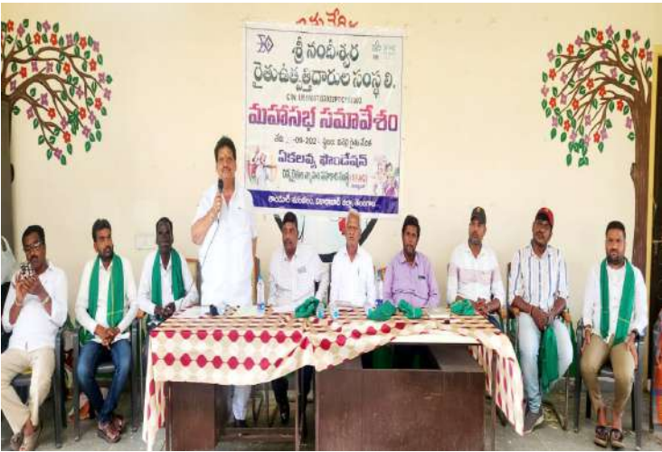
-90 శాతం పెట్టుబడి సహాయం