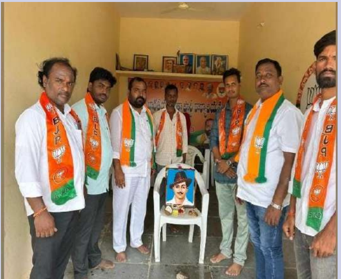
పెద్ద శంకరంపేట్ ప్రజా జ్యోతి