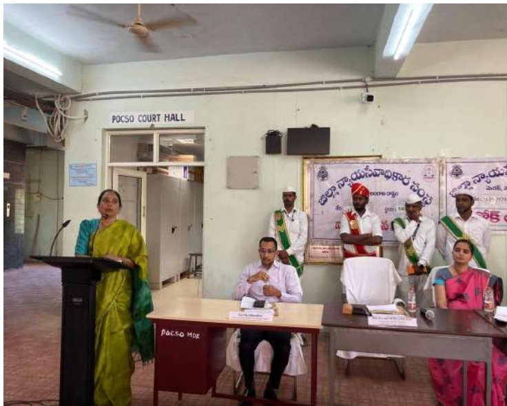
-జిల్లా ప్రధాన న్యాయమూర్తి లక్ష్మి శారద