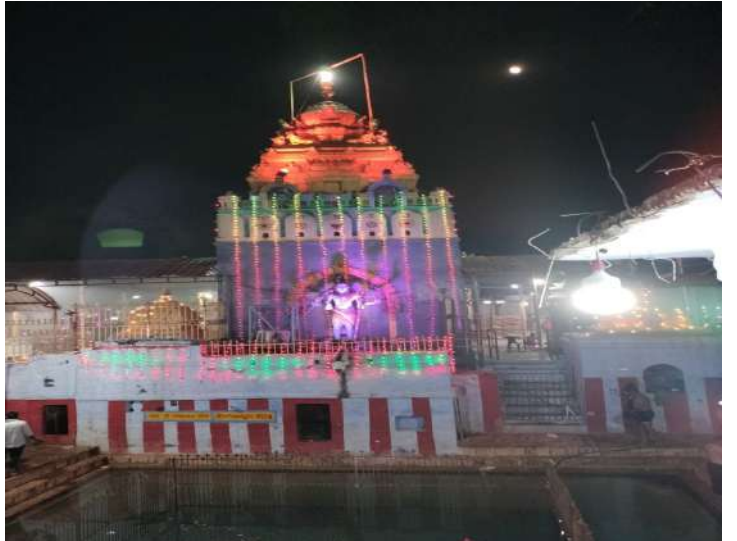
కలగకుండా ఆలయ అధికారులు అన్ని ఏర్పాట్లు చేశారు.

జహీరాబాద్, సెప్టెంబర్ 28 ( ప్రజా జ్యోతి న్యూస్ ) శ్రీ కేతకి సంగమేశ్వర స్వామి దేవస్థానంలో శ్రీ శరన్నవ రాత్రి దుర్గాదేవి దసరా మహోత్సవములు ఈనెల మూడవ తేదీ నుండి ప్రారంభం కానుంది స్వస్తిశ్రీ క్రోధి నమ సంవత్సరము అశ్వయుజ శుద్ధ పాడ్యమి గురువారం మూడవ తేదీ నుండి 12వ తేదీ శనివారం వరకు దేవస్థానంలో శ్రీశ్రీశ్రీ అధిపరశక్తి అఖిలాండకోటి బ్రహ్మాండ నాయకి ఇచ్చశక్తి జ్ఞాన శక్తి క్రియ శక్తి స్వరూపిణి అయినటువంటి శ్రీశ్రీశ్రీ పార్వతి దేవి అమ్మవారి శరన్నవరాత్రి ఉత్సవాలు వైభవమేతముగా నిర్వహించుటకు నిర్ణయించడమైనది ప్రతిరోజు పూజా కార్యక్రమాలు మూడవ తేదీ నుండి ప్రతిరోజు ప్రాతం కాలం సమసయమును అమ్మవారికి అభిషేక అలంకారము మరియు ఉదయం 9:30 నుంచి భక్తుల చేత విగ్నేశ్వర పూజ చతుష్టి సహిత ఆవరణసర్పలు మరియు లలిత హోమం చేయించబడును తదుపరి ఉభయ దాతలకు తీర్థ ప్రసాదాలు వినియోగించు కోవాలని భక్తులకు ఎటువంటి ఇబ్బందులు