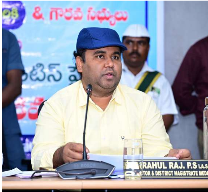
-ఎస్సీ, ఎస్టీల చట్టాలపై అవగాహన కల్పించాలి

-అట్రాసిటీ కేసుల పరిహారం నిబంధనల ప్రకారం సకాలంలో అందించాలి