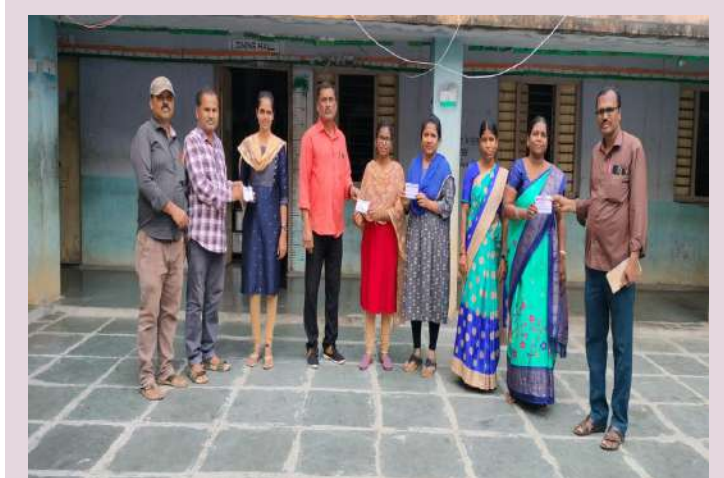
మెడక్ ( ప్రజాజ్యోతి )