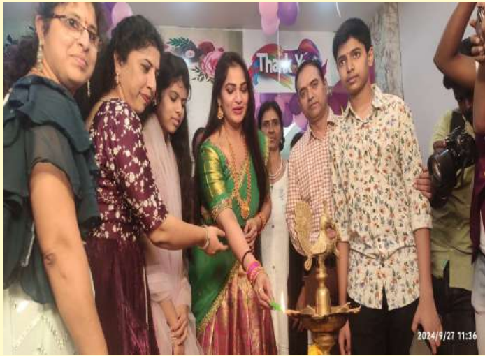
అబ్దుల్లాపూర్ మెట్ సెప్టెంబర్ 27 (ప్రజా జ్యోతి)