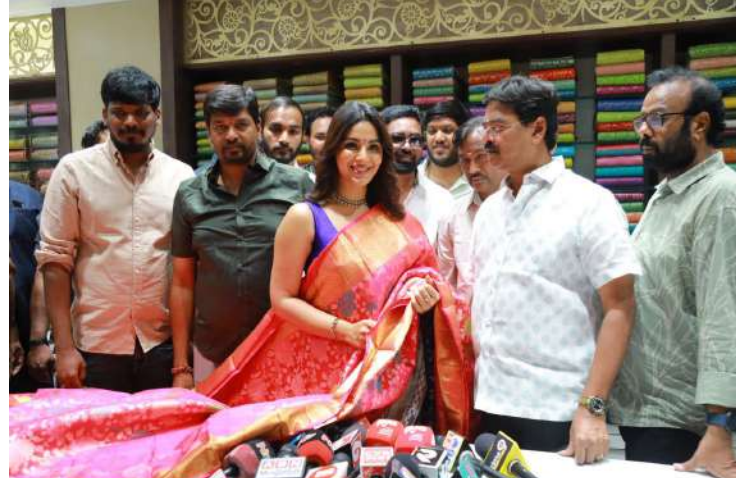
-సందడి చేసిన సిసీనటి సంయుక్త మీనన్..