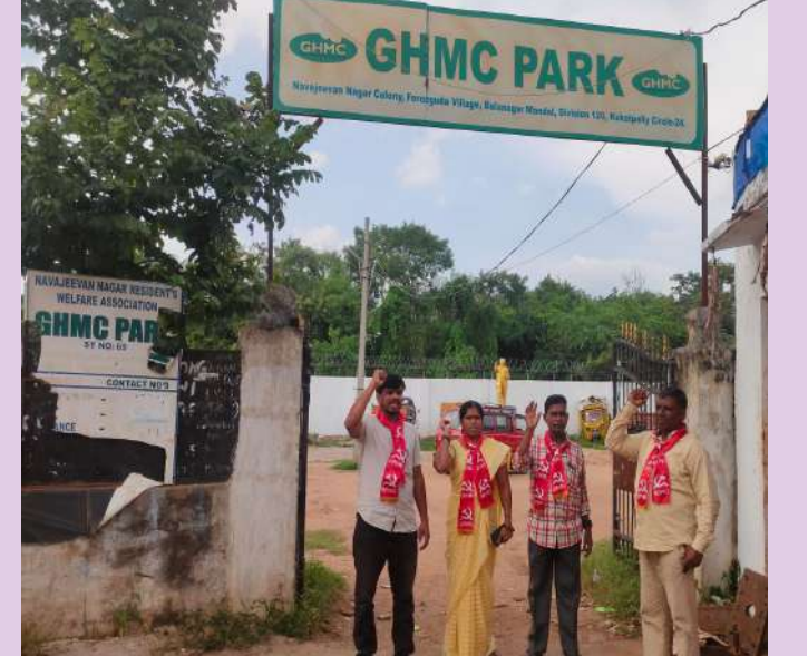
బాలానగర్, సెప్టెంబర్ 27 ( ప్రజా జ్యోతి ) :