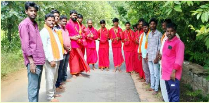
పాపన్నపేట, సెప్టెంబర్ 27 (ప్రజాజ్యోతి):