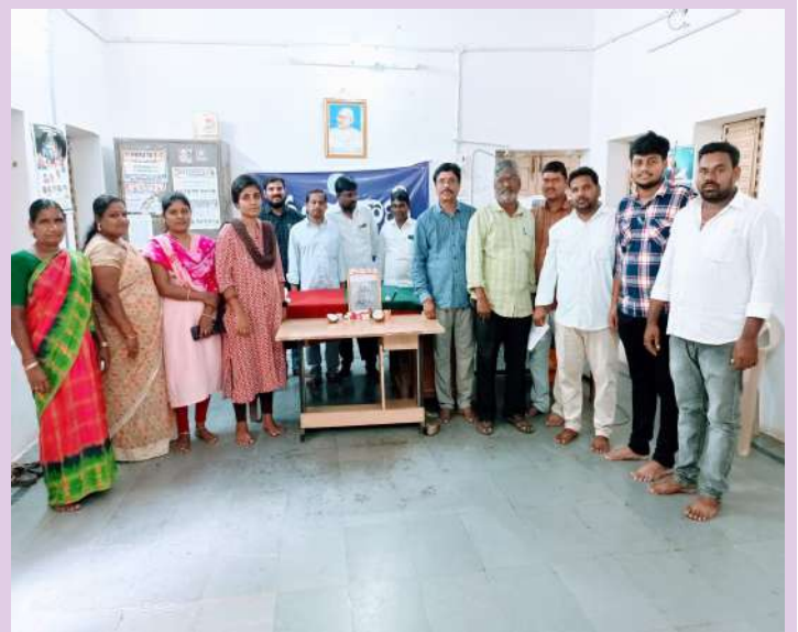
పుల్కల్ మండల్ ప్రజా జ్యోతి సెప్టెంబర్ 27: