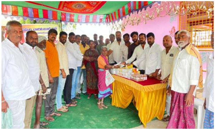
-ఉప్పల చారిటబుల్ ట్రస్ట్ సేవలు ఎప్పటికీ నిరంతరం పేద ప్రజలు బాగుండాలని

(ప్రజా జ్యోతి సెప్టెంబర్ 27/ తలకొండపల్లి)