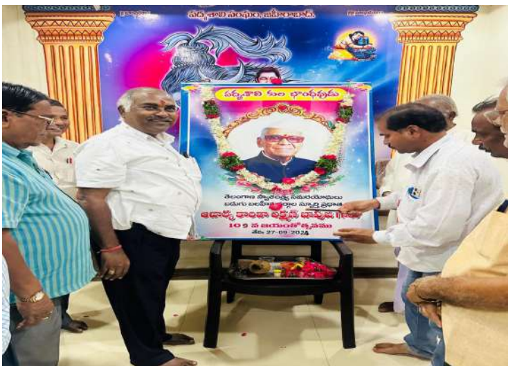
జహీరాబాద్, సెప్టెంబర్ 27 ( ప్రజా జ్యోతి న్యూస్ )

- ఘనంగా నిర్వహించిన జహీరాబాద్ పద్మశాలి సంఘం