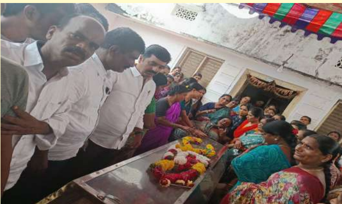
(ప్రజా జ్యోతి సెప్టెంబర్ 27/ తలకొండపల్లి)

-బిఆర్ఎస్ పార్టీ నాయకులతో కలిసి తలకొండపల్లి మాజీ ఎంపీపీ సీఎల్