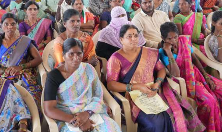
అక్రమనలకు గురి కాకుండా దేవాలయానికి పట్టా చెయ్యాలి అని కోరారు.