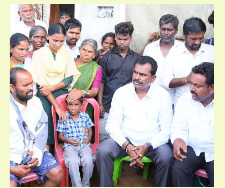
వనపర్తి జిల్లా ప్రతినిధి, సెప్టెంబర్ 24(ప్రజా జ్యోతి):