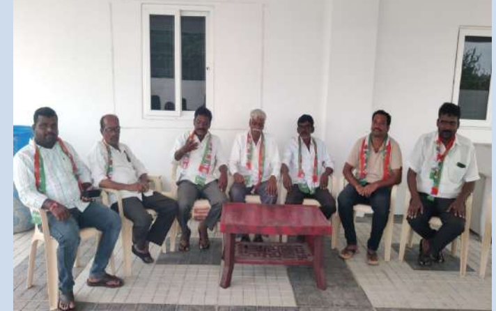
చేర్యాల ప్రజాజ్యోతి :

-మీడియా సమావేశంలో ముస్తాల కాంగ్రెస్ నాయకుల హెచ్చరిక