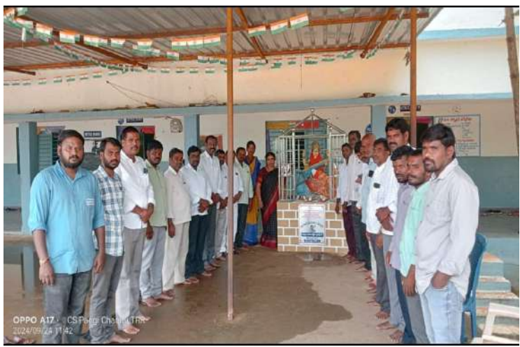
చౌడపూర్ మండల ( ప్రజా జ్యోతి ) సెప్టెంబర్ 24 :