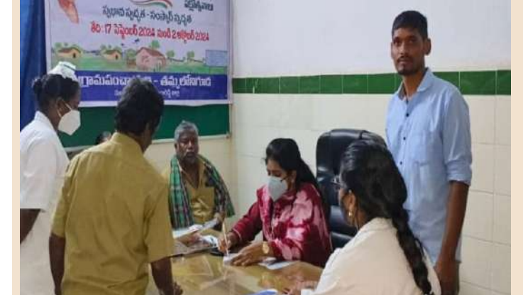
యాచారం, సెప్టెంబర్ 24 (ప్రజాజ్యోతి):

నిత్యం గ్రామాల్లో పరిసరాల పరిశుభ్రతకు ప్రాధాన్యతనిస్తున్న పారిశుధ్య కార్మికుల కుటుంబాలకు ఆరోగ్య పరీక్షలు నిర్వహించనున్నట్లు ఎంపీడివో నరేందర్ రెడ్డి, ఎంపీఓ శ్రీలత మంగళవారం పేర్కొన్నారు. స్వచ్ఛత హి సేవ కార్యక్రమాల్లో భాగంగా జిల్లా కలెక్టర్ ఆదేశాలకు అనుగుణంగా పారిశుధ్య కార్మికుల కుటుంబాలకు వైద్య ఆరోగ్య పరీక్షలు నిర్వహిస్తున్నట్లు పేర్కొన్నారు. మండలంలోని 24 గ్రామాలను 5 క్లస్టర్లుగా విభజించి ఒక్కో రోజు ఆయా గ్రామాల్లో పారిశుధ్య కార్మికుల కుటుంబాలకు వైద్య ఆరోగ్య పరీక్షలు నిర్వహించనున్నట్లు తెలిపారు. కాగా మంగళవారం 1వ క్లస్టర్ లో మాల్, మంతన్ గొరెల్లి, నల్లవెల్లి, తమ్మలోనిగుడా, కేసీ తండాల్లో వైద్య బృందం పరీక్షలు నిర్వహించారని అన్నారు. ఈనెల 26న 2వ క్లస్టర్ గుణగల్, గడ్డమల్లయ్యగూడ, తులెఖూర్లు, ధర్మన్నగూడలో వచ్చేనెల 1న 3వ క్లస్టర్ లో యాచారం, తక్కులపల్లితండా, చౌదర్పల్లి, చింతపల్ల, మొండిగొరెల్లి, 3న 4వ క్లస్టర్లోని కొత్తపల్లి, మల్లీజుగూడ, మేడిపల్లి, నానక్ నగర్, తక్కులపల్లి, 6న 5వ క్లస్టర్లో అయ్యవారిగూడెం, కురుమిద్ద, నందివనపర్తి, నజ్జిక్ సింగారం, తాడిపర్తిలో ఆరోగ్య పరీక్షలు నిర్వహించబడునని అవకాశాన్ని సద్వినియోగం చేసుకోవాలని సూచించారు.