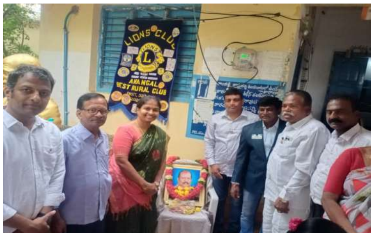
-కమిటీ సభ్యులు రూరల్ క్లబ్ లకే ఆదర్శం లైన్స్ క్లబ్ ఆఫ్ ఆమనగల్లు