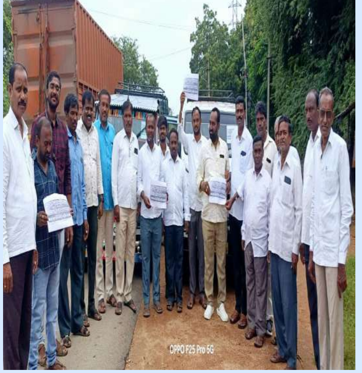
పాపన్నపేట, సెప్టెంబర్ 24 (ప్రజాజ్యోతి):