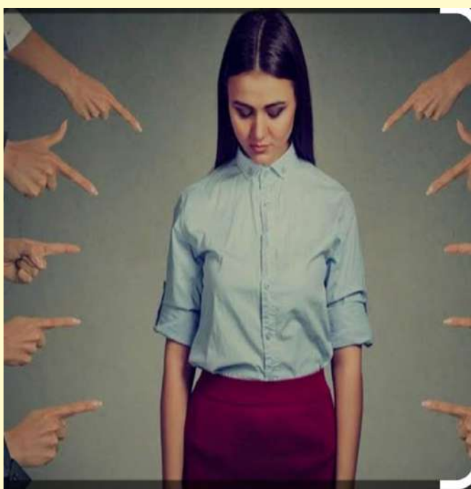
కల్వేర్ 24 సెప్టెంబర్ ప్రజాజ్యోతి

ఉమ్మడి మెదక్ సంగారెడ్డి జిల్లాలో పోకిరీలు రెచ్చిపోతున్నారు. జిల్లాలో ఎక్కడో ఒకచోట అత్యాచారాలు, లైంగిక వేధింపు కేసులు నమోదవుతూనే ఉన్నాయి. వీటికి చెక్ పెట్టేందుకు పోలీసు అధికారులు చర్యలు చేపట్టారు. అత్యవసర సమయాల్లో మహిళలకు రక్షణ గా టోల్ ఫ్రీ నంబర్లను, యాప్లను పోలీసు అధికారులు తీసుకొచ్చారు. చైల్డ్ హెల్పులైన్-1098, షీ టీం-8712657963, భరోసా-08457293098, మహిళా హెల్ప్ లైన్-181, మిషన్ పరివర్తన-14446, పోక్స్ ఈ బాక్స్, 112 యాప్లు ఉన్నాయి. సందర్శించండి వేటిని ఉపయోగించండి అని పోలీసు అధికారులు తెలియజేశారు