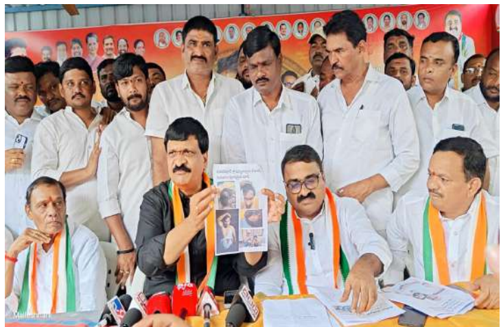
-సంచలన వ్యాఖ్యలు చేసిన మైనంపల్లి