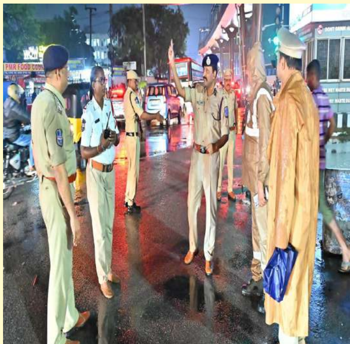
ఉప్పల్ 24 ( ప్రజాజ్యోతి ప్రతినది)

రాష్ట్రవ్యాప్తంగా భారీ వర్షాలు కురుస్తున్న నేపథ్యంలో రాచకొండ కమిషనర్ సుధీర్ బాబు ఈరోజు ఉప్పల్ పరిధిలోని రోడ్లను స్వయంగా పరిశీలించారు. క్షేత్రస్థాయిలో పనిచేస్తున్న సిబ్బంది మరియు అధికారులతో కలిసి ట్రాఫిక్ తీరును పర్యవేక్షించారు. రోడ్లమీద నీరు అధికంగా చేరిన చోట వాహనదారులు ఇబ్బందులు పడకుండా మరియు ట్రాఫిక్ జాములు వంటి వాటిని మెరుగుపరచడానికి సిబ్బందికి పలు సూచనలు చేశారు. ఉప్పల్ నుంచి బోడుప్పల్ వరకు గల రోడ్లను కమిషనర్ స్వయంగా పరిశీలించి రోడ్ల పరిస్థితిని సమీక్షించారు. నిండు వర్షంలో కూడా రోడ్ల మీద ట్రాఫిక్ నియంత్రణ కోసం నిబద్ధతతో పనిచేస్తున్న ట్రాఫిక్ సిబ్బందిని కమిషనర్ అభినందించారు.