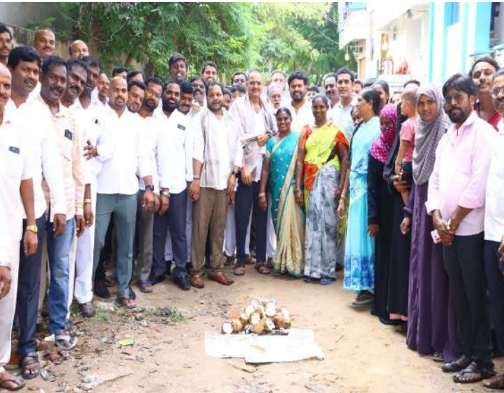
ఉప్పల్ 24 (ప్రజా జ్యోతి ప్రతినిధి)