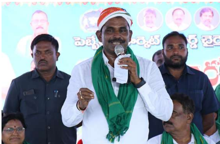
-రైతు రుణమాఫీ పై మాట్లాడి నైతిక హక్కు బిఆర్ఎస్ నాయకులకు లేదు

-మార్కెట్ యార్డును అన్ని రకాలుగా అభివృద్ధి చేసుకుందాం