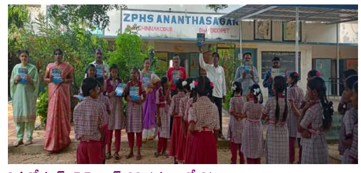
చిన్నకోడూర్, సెప్టెంబర్ 23 (ప్రజా జ్యోతి):