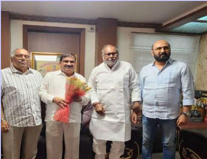
బషీరాబాద్ సెప్టెంబర్ 23 ప్రజా జ్యోతి

-శుభాకాంక్షలు తెలిపిన మాజీ ఎమ్మెల్యే యం నారాయణ మహారాజ్, స్టేట్ ఫైనాన్స్ మెంబర్ రమేష్ మహారాజ్,