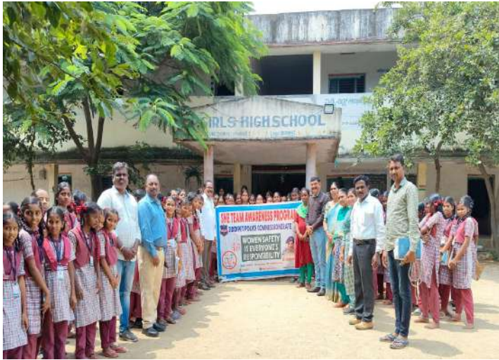
-సోషల్ మీడియాకు ఎంత దూరం ఉంటే భవిష్యత్తు అంతా బాగుంటుంది

-మహిళల భద్రతకు ఎల్లవేళలా అందుబాటులో ఉంటాం