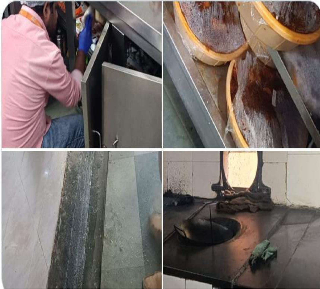
-భద్రత ప్రమాణాలు పాటించని రెస్టారెంట్లు, హోటళ్లు, హాస్టళ్లు