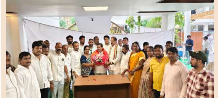
కూకట్ పల్లి, సెప్టెంబర్ 23 (ప్రజా జ్యోతి) :