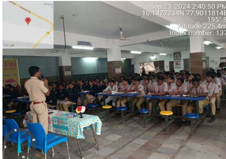
-పిల్లల భవిష్యత్తుకు వెలుగులు అందించడం ప్రతి ఒక్కరి బాధ్యత