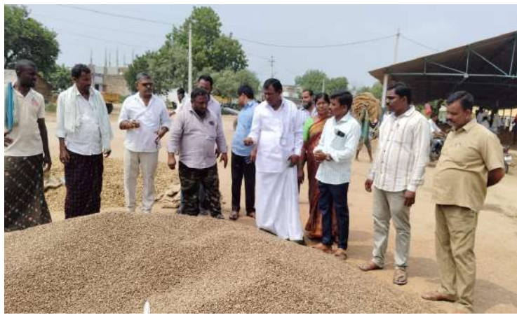
-మార్కెట్ చైర్మన్ కుర్వ నల్ల హనుమంతు