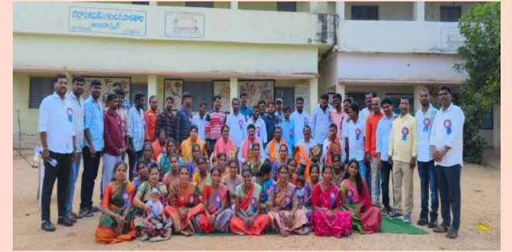
కొమురవెల్లి, సెప్టెంబర్ 23, (ప్రజాజ్యోతి)