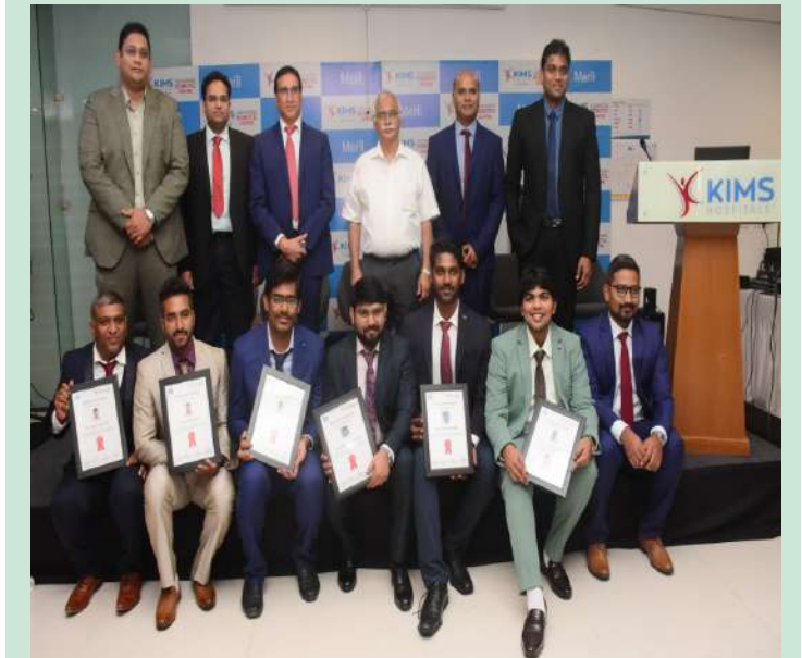
హైదరాబాద్, సెప్టెంబర్ 21 (ప్రజా జ్యోతి) :

-ఆరుగురు ఆర్థోపెడిక్ సర్జన్లకు శిక్షణ, ఫెలోషిప్లు