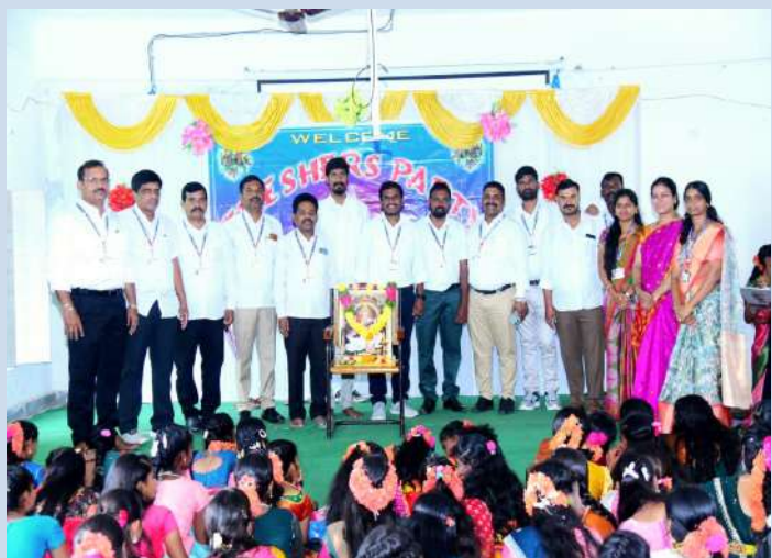
పాపన్నపేట, సెప్టెంబర్ 21 (ప్రజాజ్యోతి):