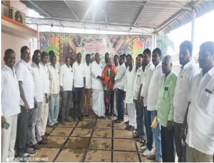
శాలువతో సన్మానించి కృతజ్ఞతలు తెలిపారు. ఈ కార్యక్రమంలో కాంగ్రెస్ పార్టీ నాయకులు పాల్గొన్నారు.