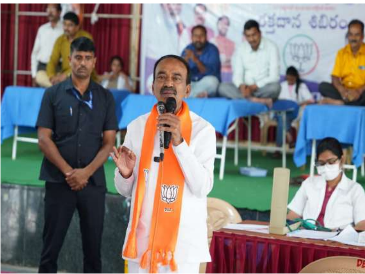
ఉప్పుల 21 ( ప్రజాజ్యోతి ప్రతినీధి )

బీజేపీ సిద్ధాంతకర్త డీన్ దయాల్ ఉపాధ్యాయ, మహాత్మాగాంధీ, లాల్ బహదూర్ శాస్త్రి, ప్రధాని నరేంద్ర మోడీ పుట్టినరోజులు సెప్టెంబర్ 17 నుండి అక్టోబర్ 2 వ తేదీ మధ్యలో వస్తున్నాయి. రక్తదాన శిబిరాలు, హెల్త్ క్యాంపులు, స్వచ్ఛభారత్ కార్యక్రమాలు జరుగుతున్నాయి. ఈ కార్యక్రమాలు దేశవ్యాప్తంగా జరుగుతున్నాయి అందులో మన దగ్గర కూడా గొప్పగా నిర్వహిస్తున్న నాయకత్వానికి, డాక్టర్లుకు ధన్యవాదాలు తెలియజేస్తున్నాను. రక్తదానం చేసిన ప్రతి ఒక్కరికి ధన్యవాదములు. పర్వతాపూర్ గ్రామం, పీర్జాదిగూడ ప్రజలు నన్ను గొప్పగా ఆదరించి, మెజార్డ్ ఇచ్చినందుకు చాలా సంతోషం. మీ అందరికీ కృతజ్ఞతలు. పీర్జాదిగూడలో ఆరు బూత్ లు ఉన్నాయి. పదివేల మంది జనాభా ఉన్నారు. అందులో ఐదు శాతం మంది మాత్రమే పార్టీల పరంగా ఉంటారు మిగతా వారంతా కూడా న్యూట్రల్ గా ఉండే ఆస్కారం ఉంది కాబట్టి మీరు ప్రతి ఒక్కరి ఇంటికి వెళ్లి సభ్యత్వ నమోదు