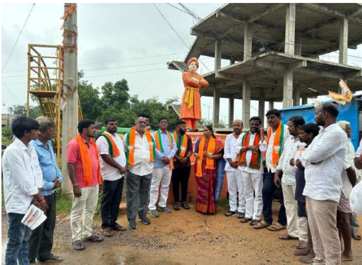
- 200 సభ్యత్వాలు పూర్తి చేసిన వారికే క్రియాశీల