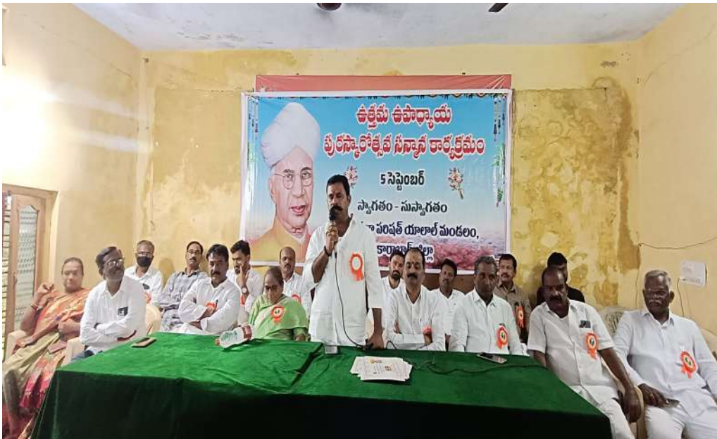
యాలాల్ సెప్టెంబర్ 21 ప్రజా జ్యోతి