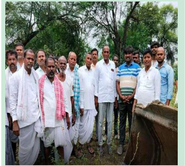
కల్లెర్ సెప్టెంబర్ 21 ప్రజా జ్యోతి