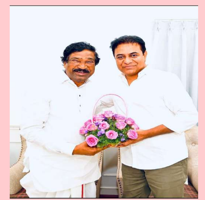
నందిగామ, సెప్టెంబర్ 20 (ప్రజాజ్యోతి):