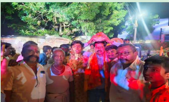
శివంపేట ప్రజాజ్యోతి సెప్టెంబర్ 20