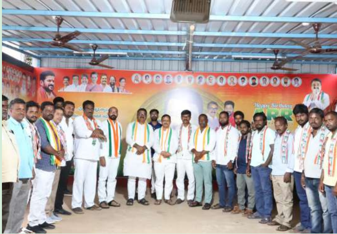
శివంపేట ప్రజాజ్యోతి సెప్టెంబర్ 20