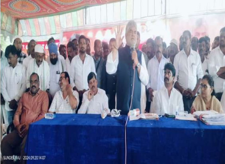
మోమిన్ పెట్ సెప్టెంబర్ 20. (ప్రజా జ్యోతి):

ఆరు గ్యారంటీలు అమలు చేయడమే మన ప్రజా ప్రభుత్వ లక్ష్యమని తెలంగాణ రాష్ట్ర శాసన సభాపతి గడ్డం ప్రసాద్ కుమార్ అన్నారు. శుక్రవారం మోమిన్ పెట్ మండల పరిషత్ కార్యాలయ ఆవరణలో మహాలక్ష్మి పథకంలో భాగంగా సబ్సిడీ ద్వారా రూ. 500.లకు గ్యార్స్ సిలిండర్ పొందుతున్న లబ్ధిదారులకు (ప్రాసీడింగ్) గుర్తింపు పత్రాలు పంపిణీ కార్యక్రమానికి ముఖ్య అతిథిగా హాజరై ఎమ్మెల్యే ప్రసాద్ కుమార్ గ్యార్స్ సిలిండర్ పొందుతున్న లబ్ధిదారులకు గుర్తింపు పత్రాలు పంపిణీ చేశారు. ఈ సందర్భంగా ఆయన మాట్లాడుతూ ఎన్నికల్లో ఇచ్చిన హామీల ప్రకారం ముఖ్యమంత్రిగా రేవంత్ రెడ్డి మాట నిలబెట్టుకున్నారని అన్నారు. ప్రతిపక్షాలు ఎన్ని అసత్యాలు ప్రచారం చేసిన 6 గ్యారంటీలు అమలు చేయడమే ప్రభుత్వ లక్ష్యం అన్నారు. యావత్ తెలంగాణలో ఉన్న ఆడపడుచుల ఆశీస్సులతో ఏర్పడిన ప్రభుత్వం మన ప్రజా ప్రభుత్వం ఏర్పడిన రెండు రోజుల్లోనే మహిళలకు ఉచిత బస్సు సౌకర్యం కల్పించిన ఘనత ముఖ్యమంత్రి రేవంత్ రెడ్డికి దక్కిందన్నారు. బి.ఆర్.ఎస్, బీజేపీ పాలనలో మహిళలకు తీవ్ర అన్యాయం జరిగిందని పేర్కొన్నారు. మహిళా సంఘాలకు పావుల వడ్డీ రుణాలు గత ప్రభుత్వం ఇవ్వలేదన్నారు. సిలిండర్ ధర రూ. 400 నుండి 1000, రూపాయల వరకు పెంచిన ఘనత గత ప్రభుత్వానిదే అని అన్నారు. గతంలో కూడ మహిళలకు చేయూతను అందించిన ఘనత కాంగ్రెస్ ప్రభుత్వమేనని అన్నారు. మళ్లీ కాంగ్రెస్ ప్రభుత్వం ఏర్పడిన వెంటనే మహిళా