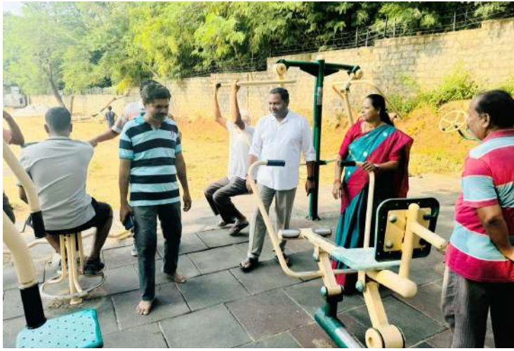
-బన్నాల గీతా ప్రవీణ్