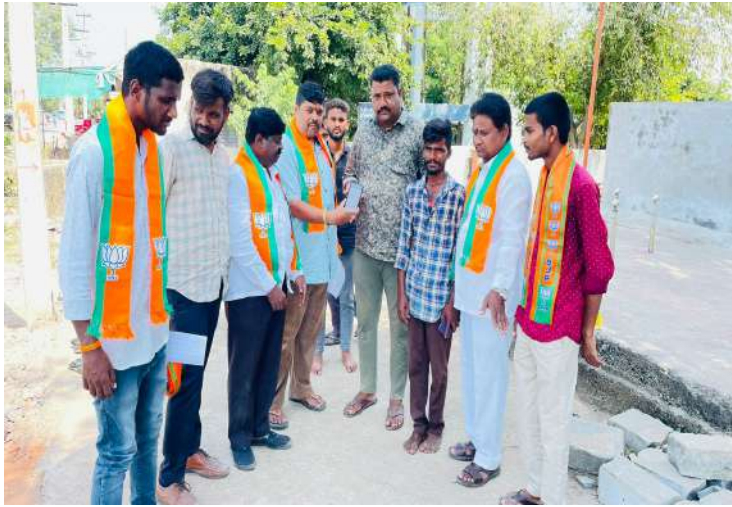
-దేశంలోనే అత్యధిక సభ్యత్వం గల పార్టీగా గుర్తింపు -మండల పార్టీ అధ్యక్షుడు ప్రభు శంకర్