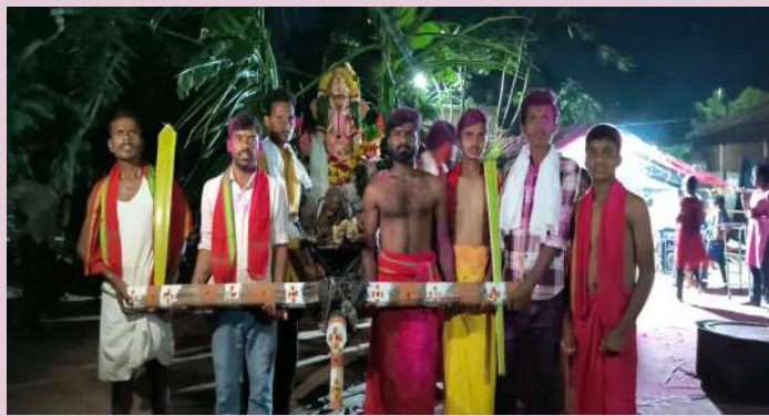
జగదేవపూర్, సెప్టెంబర్ 19 (ప్రజాజ్యోతి)

గణపతి నవరాత్రి ఉత్సవాలలో భాగంగా బుధవారం రాత్రి జగదేవపూర్ మండలంలో అన్ని గ్రామాల్లో నిమజ్జనం చేశారు. జంగారెడ్డిపల్లి గ్రామంలో గణపతిని ఎడ్ల బండిపై ఊరేగింపుగా నిమజ్జనం చేశారు. జగదేవపూర్ లో లైటింగ్ తో పాటు వివిధ వేషాదరణలతో నృత్యాలు చేయడం అందరిని ఆకట్టుకుంది. తిగుల్ గ్రామంలో రాధాకృష్ణ స్టార్ యూత్ ఆధ్వర్యంలో డోన్ కెమెరాతో ఊరేగింపు ఘనంగా నిర్వహించారు.