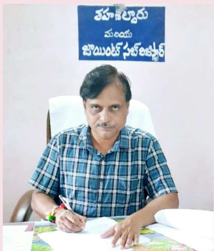
పాపన్నపేట, సెప్టెంబర్ 19 (ప్రజాజ్యోతి):