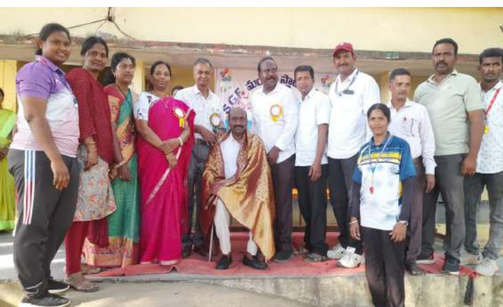
చేగుంట ప్రజా జ్యోతి సెప్టెంబర్ 19