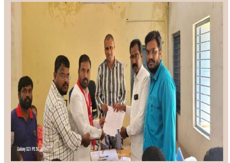
యాచారం, సెప్టెంబర్ 19 (ప్రజాజ్యోతి):