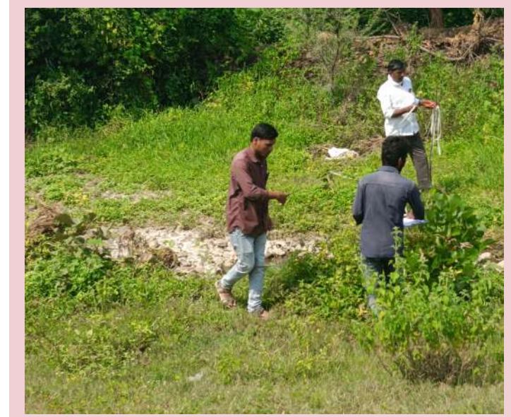
సిర్సాపూర్ సెప్టెంబర్ 19 (ప్రజాజ్యోతి):

సంగారెడ్డి జిల్లా సిర్సాపూర్ మండలం పరిధిలోని రూప్ల తండాలో గురువారం సామాజిక తనిఖీ కార్యక్రమాన్ని చేపట్టారు. గతేడాది ఏప్రిల్ 1 నుంచి 2023 నుంచి మార్చి 31, 2024 వరకు గ్రామంలో ఉపాధి హామీ పథకంలో చేపట్టిన అభివృద్ధి పనులను DRP పరిశీలించారు. ఈ మేరకు రాతి కట్టడాల నిర్మాణాల కొలతలు తీసుకున్నారు. ఇక్కడ జరిపిన సామాజిక తనిఖీ సమాచార వివరాలు ఈనెల 23న ప్రజాదర్శార్ లో చర్చిస్తామని DRP తెలిపారు. ఈయన వెంట FA ఉన్నారు.