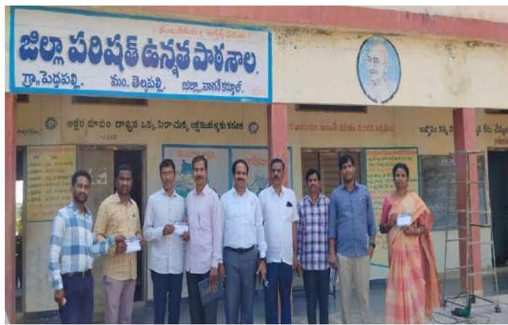
నాగర్ కర్నూల్ ప్రజా జ్యోతి 19 సెప్టెంబర్

బదిలీ అయిన ఎస్టిలను విడుదల చేయాలని ఎస్ టి టి యు యూనియన్ నాయకులు డిమాండ్ చేశారు. గురువారం తెలకపల్లి మండలంలోని గౌరెడ్డి పల్లి, లక్కూరు, గోలగుండం, పెద్దూరు, ఆలేరు, బొప్పల్లి, పెద్దపల్లి ప్రాథమిక, ప్రాథమికోన్నత, ఉన్నత పాఠశాలలను సందర్శించి ఉపాధ్యాయుల సమస్యలను తెలుసుకుంటూ ఎస్ టి యు సభ్యులు సభ్యత్వాలను నమోదు చేశారు. ఈ సందర్భంగా