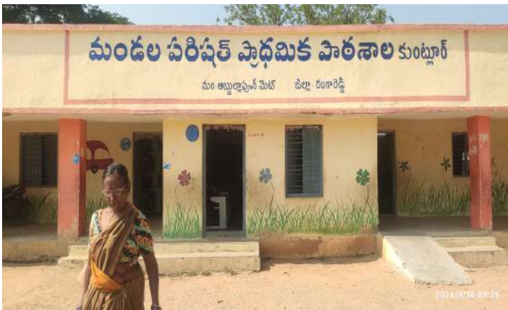
-కిటికీ దోర్లు పగలగొట్టి వంట పాత్రల చోరికి యత్నం -స్కూల్ ఆవరణలో గుట్టాలు నమిలి ఉమ్మివేసి కలుషితం చేస్తున్న ఆకతాయిలు -సీసీ కెమెరాలు ఏర్పాటు చేయాలంటూ అధికారులకు

విద్యార్థుల తల్లిదండ్రుల విజ్ఞప్తి అబ్దుల్లాపూర్ మెట్ సెప్టెంబర్ 19 (ప్రజాజ్యోతి)