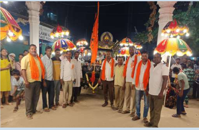
సందిగామ, సెప్టెంబర్ 19 (ప్రజాజ్యోతి):