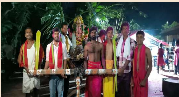
జగదేవపూర్, సెప్టెంబర్ 19 (ప్రజాజ్యోతి)

గణపతి నవరాత్రి ఉత్సవాలలో భాగంగా బుధవారం రాత్రి జగదేవపూర్ మండలంలో అన్ని గ్రామాల్లో నిమజ్జనం చేశారు. జంగారెడ్డిపల్లి గ్రామంలో గణపతిని ఎడ్ల బండిపై ఊరేగింపుగా నిమజ్జనం చేశారు. జగదేవపూర్ లో లైటింగ్ తో పాటు వివిధ వేషాదరణలతో నృత్యాలు చేయడం అందరిని ఆకట్టుకుంది. తిగుల్ గ్రామంలో రాధాకృష్ణ స్టార్ యూత్ ఆధ్వర్యంలో డోన్ కెమెరాతో ఊరేగింపు ఘనంగా నిర్వహించారు.