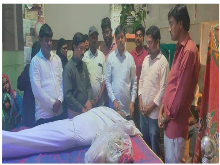
-ఫోటోగ్రాఫర్ జిల్లా అధ్యక్షుడు నేతాజీ గౌడ్