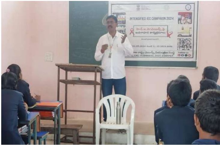
-జిల్లా వైద్య ఆరోగ్యశాఖ ఆధ్వర్యంలో సివి రామన్ పాఠశాలలో ఇంటెన్సిఫైడ్ క్యాంపెయిన్

హుస్సాబాద్, సెప్టెంబర్ 19 (ప్రజా జ్యోతి):