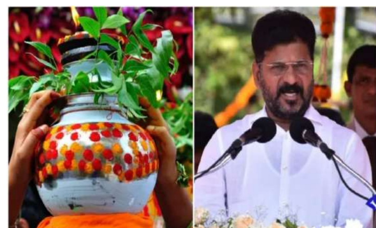
విషయానికి వస్తే అక్టోబర్ 6వ తేదీ నుంచి 13వ తేదీ వరకు సెలవులు ప్రకటించింది.

-అక్టోబర్ 2వ తేదీ నుంచి 14వ తేదీ వరకు సెలవులు ప్రత్యేకప్రతినిధి ప్రజాజ్యోతి తెలంగాణ రాష్ట్ర ప్రభుత్వం తాజాగా దసరా పండగ సెలవులను ప్రకటించింది. రాష్ట్రంలోని స్కూల్స్, కాలేజీలకు దసరా సెలవులను ప్రకటిస్తూ గురువారం ఉత్తర్వులు జారీ చేసింది. దసరా పండగ నేపథ్యంలో మొత్తం 13 రోజుల పాటు సెలవులను డిక్లేర్ చేసింది తెలంగాణ ప్రభుత్వం. అక్టోబర్ 2వ తేదీ (బుధవారం) నుంచి 14వ తేదీ (సోమవారం) వరకు సెలవులుగా ప్రకటించింది. అక్టోబర్ 2వ తేదీ గాంధీ జయంతితో సెలవులు మొదలు కానున్నట్లు పేర్కొంది. ఆ తర్వాత నుంచి బతుకమ్మ, దసరా సెలవులు ఉంటాయని విద్యార్థులు అధికారులు తెలిపారు. ఇప్పటికే కొన్ని ప్రైవేట్ పాఠశాలలు అక్టోబర్ 1వ తేదీ నుంచి దసరా సెలవులు ఇస్తున్నట్లు ప్రకటించాయి. ఇక జూనియర్ కాలేజీల