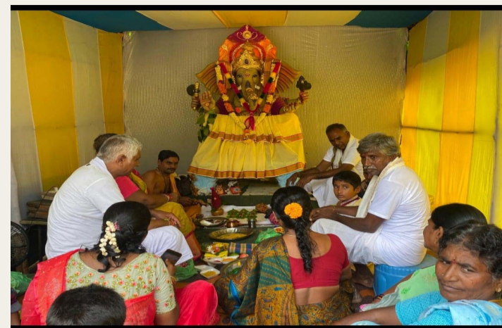
ఘనంగా పూజలు నిర్వహించిన భక్తులు.