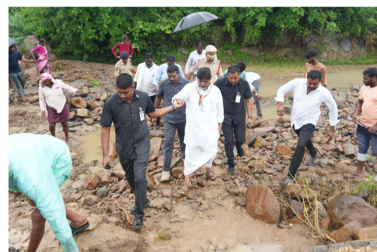
నియోజకవర్గంలోని అన్ని మండలాల్లో పర్యటించి వరద బాధితులకు భరోసా ఇచ్చారు.. దెబ్బతిన్న ప్రాంతాల్లో సాహసోపేతంగా పర్యటించారు. దెబ్బతిన్న రోడ్లు, బ్రిడ్జిలు, చెరువుల పునర్నిర్మాణానికి ఆదేశాలు జారీ చేశారు. వరద ప్రవాహంలో కొట్టుకుపోయిన మృతి చెందిన రెండు బాధ్యత కుటుంబాలకు 5 లక్షల రూపాయల చొప్పున చెక్కులను అందజేశారు. ఆదివారం ఉదయాన్నే ముదిగొండ మండల కేంద్రంలో ప్రభుత్వ ఆరోగ్య కేంద్రాన్ని సందర్శించారు.. తదుపరి చిరుమర్రి గ్రామంలో వరద నష్టం ప్రాంతాల్లో పరిశీలించారు. ముదిగొండ మండలం కమలాపురంలో నీట మునిగిన జిల్లా పరిషత్ పాఠశాలను సందర్శించారు. ఆరడుగుల మేర మట్టితో నింపాలని, చదువులో దెబ్బతిన్న కాలువను పునర్ నిర్మించాలని ఆదేశించారు. అయ్యవారిపల్లె, వల్లభి గ్రామాల్లో తెగిన చెరువు కట్టలు నీట మునిగిన పంట పొలాలను తెగిపోయిన రోడ్డును పరిశీలించి పూర్తిస్థాయిలో మరమ్మత్తులకు అంచనాలు రూపొందించాలని, రిటైనింగ్ వాల్ నిర్మాణానికి ప్రతిపాదనలు పంపాలని ఆదేశించారు. చింతకాని మండలం మత్తేపల్లి నామవరం వద్ద ఉధృతంగా ప్రవహిస్తున్న గట్టు బంధం చెరువు ప్రవాహం వల్ల మతికేపల్లి తిరుమలాపురం రహదారి మీద భారీగా గండ్లు ఏర్పడ్డాయి రోడ్డు ఎక్కడికక్కడికి కోతకు గురైన రోడ్డును పరిశీలించారు. వాగులు నుంచి వంకల నుంచి ఉధృతంగా ప్రవహిస్తున్న నేటితో చెరువులు ఎక్కడికి అక్కడికి కట్టలు తెగతున్నాయి. తుమ్మలమ్మ చెరువు, మూడు నేరేడు చెరువులు, చిన్నగోపతి, లచ్చగుండెం, నల్ల చెరువులకు వరద పోటెత్తడంతో మ తికేపల్లి