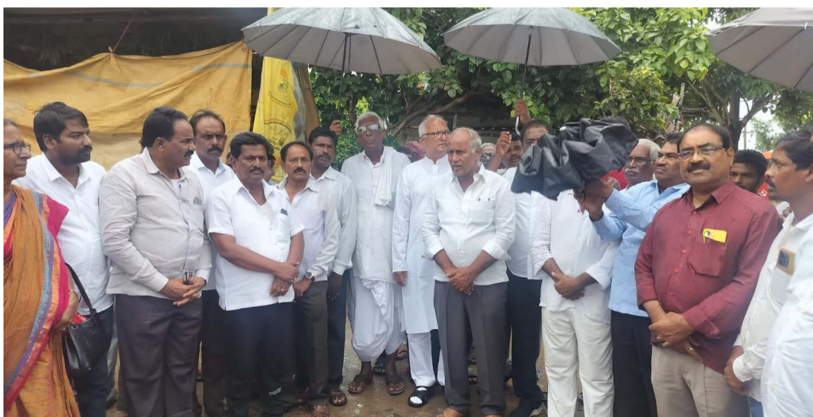
ఖమ్మం ప్రతినిధి, సెప్టెంబర్ 8, ప్రజా జ్యోతి