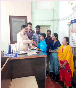
పాకెట్ మనీ తాసిల్దార్ కి అందించిన చెవుల పవన్.