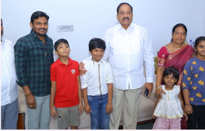
ఖమ్మం టౌన్, సెప్టెంబరు 6, ప్రజాజ్యోతి:

మున్నేరు వరదలు ఖమ్మం లోని అనేక ప్రాంతాల్లోని ప్రజానీకాన్ని అతలాకుతలం చేశాయి. ఈ సంఘటన పిల్లలను కలచి వేసింది. తమ తల్లిదండ్రులు తమకు దాచుకోవాలని ఇచ్చిన డబ్బులను వరద వంపు బాధితుల వారికి అందించాలని నిర్ణయించారు ఇదే విషయాన్ని తల్లిదండ్రులకు తాతలకు తెలియజేయడంతో వీరి నిర్ణయాన్ని స్వాగతించారు. వీరంతా నగరంలోని పలువురి ప్రముఖుల ఇళ్లకు చెందిన పిల్లలు కావడం గమనార్హం. .. ఖమ్మం మున్సిపల్ కార్పొరేషన్ మేయర్ మనవడు మనవరాలు, మాజీ ఎమ్మెల్సీ బాలసాని లక్ష్మీనారాయణ గారి మనవడు మనవరాలు అందరూ కలిసి వారి యొక్క వారి తల్లిదండ్రులు దాచుకోమని ఇచ్చిన డబ్బులను ఇరవై మూడు వేల రూపాయలు 23,000/- వరద బాధితుల సహాయం మంత్రివర్గులు తుమ్మల నాగేశ్వర రావు గారికి డబ్బులు అందచేయగా... తుమ్మల గారు పిల్లల అభినందించి భవిష్యత్తులో మరిన్ని సేవా కార్యక్రమాల్లో పాలు పంచుకోవాలని ఆకాంక్షించారు వారికి అభినందనలు తెలిపారు.