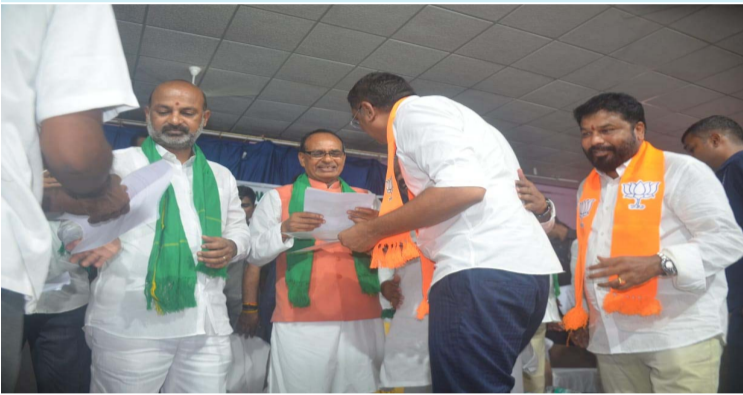
ఖమ్మం ప్రతినిధి, సెప్టెంబర్ 6, ప్రజా జ్యోతి: ఖమ్మం జిల్లాలో ఆకస్మిక వరద వలన నష్టపోయిన ఖమ్మం జిల్లా వరద ముంపు బాధితులు రైతు