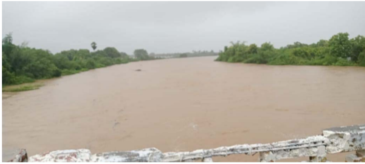
మీనవోలు కట్టేరు పొంగి పంట పొలాల్లో సముద్రాన్ని తలపించింది