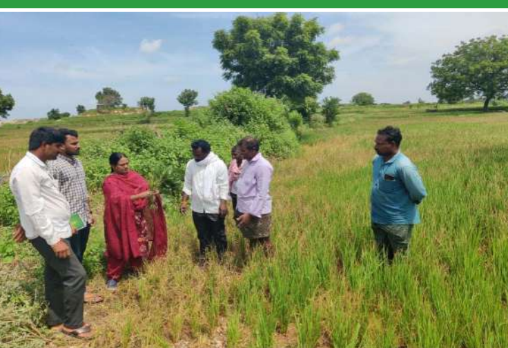
కూసుమంచి డివిజన్ సహాయ వ్యవసాయ సంచాలకులు సరిత

కూసుమంచి సెప్టెంబర్ 27 ప్రజా జ్యోతి : కూసుమంచి మండలం పరిధిలోని మల్లాయిగూడెం , హత్త తండా గ్రామాల్లో ఇటీవల నీరు లేక ఎండిపోయిన వారి పొలాలలో కూసుమంచి డివిజన్ సహాయ వ్యవసాయ