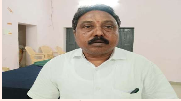
ప్రజలకు నిత్యం అందుబాటులో ఉండాలని సూచించారు.