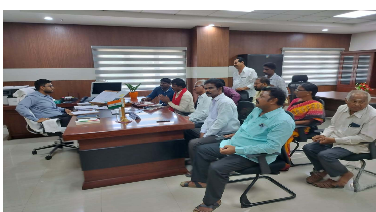
కమీషనర్ కు సి.పి.ఐ వినతి