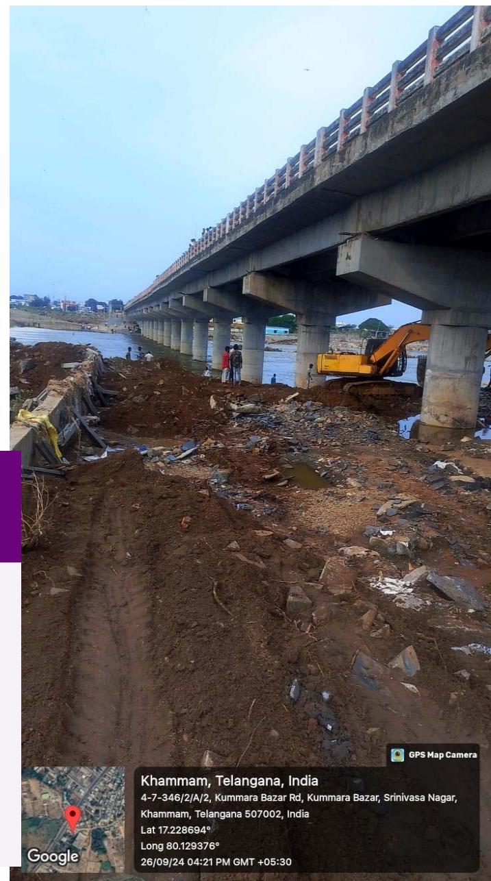
GPS Map Camera Khammam, Telangana, India 4-7-346/2/A/2, Kummara Bazar Rd, Kummara Bazar, Srinivasa Nagar, Khammam, Telangana 507002, India Lat 17.228694° Long 80.129376° 26/09/24 04:21 PM GMT +05:30