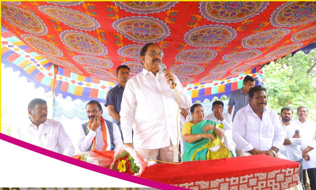
ఖమ్మం ప్రతినిధి, సెప్టెంబర్ 25, ప్రజా జ్యోతి:

మనం చేపట్టే ప్రతి అభివృద్ధి పని భవిష్యత్తు తరాలకు ఉపయోగపడాలని రాష్ట్ర వ్యవసాయ, మార్కెటింగ్, సహకార, చేనేత, జౌళీ శాఖల మంత్రి తుమ్మల నాగేశ్వర రావు తెలిపారు. బుధవారం ఖమ్మం మున్సిపల్ కార్పొరేషన్ లో మంత్రి తుమ్మల నాగేశ్వర రావు పర్యటించి 16వ డివిజన్, శ్రీరాంనగర్, రోడ్ నెం. 13లో 50 లక్షలతో చేపట్టిన స్టార్మ్ వాటర్ డ్రెయిన్ నిర్మాణ పనులకు శంకుస్థాపన చేశారు. ఈ సందర్భంగా మంత్రి తుమ్మల నాగేశ్వర రావు మాట్లాడుతూ, ఖమ్మం నగరంలో చేపడుతున్న ప్రతి అభివృద్ధి పనిని అధికారులు, ప్రజా ప్రతినిధులు మనసు పెట్టి పూర్తి చేయాలని తెలిపారు. డ్రెయిన్ నిర్మించడం వల్ల భవిష్యత్తులో ఈ డివిజన్ లో నీరు నిల్వ ఉండే పరిస్థితి రావద్దని, నాణ్యతతో కూడిన పనులు చేయాలని మంత్రి సంబంధిత అధికారులను ఆదేశించారు. (డ్రెయిన్స్) - మిగతా 3లో