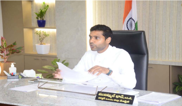
చింతకాని, సెప్టెంబర్ 25, ప్రజా జ్యోతి: అభివృద్ధి పనులకు సహకరించాలని జిల్లా కలెక్టర్ ముజమ్మిల్ ఖాన్ తెలిపారు. బుధవారం

జిల్లా కలెక్టర్ ముజమ్మిల్ ఖాన్ భూ సేకరణలో నష్టపోతున్న బాధితులకు ప్రభుత్వం చే మెరుగైన నష్టపరిహారం నేషనల్ హైవే భూసేకరణ బాధితులతో సంధి సమావేశం నిర్వహించిన జిల్లా కలెక్టర్