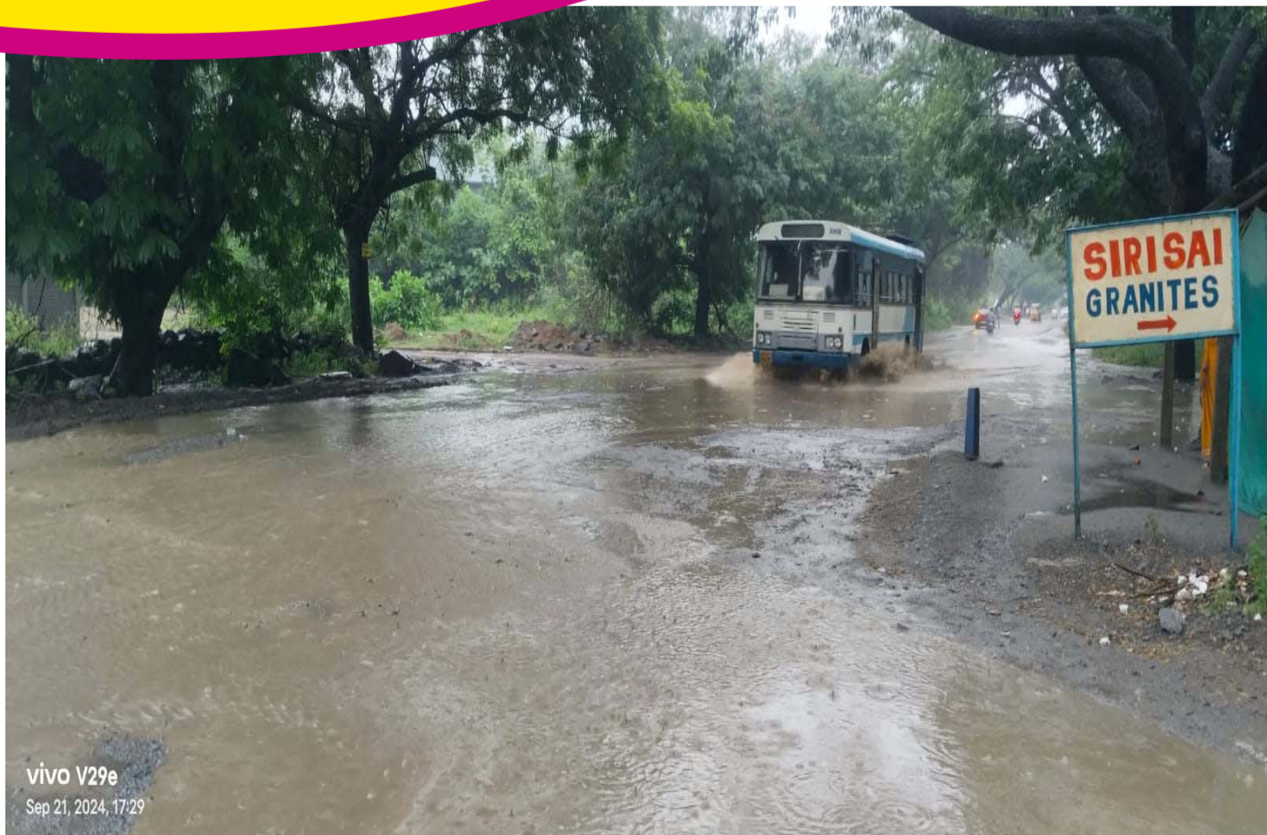
vivo V29e Sep 21, 2024, 17:29