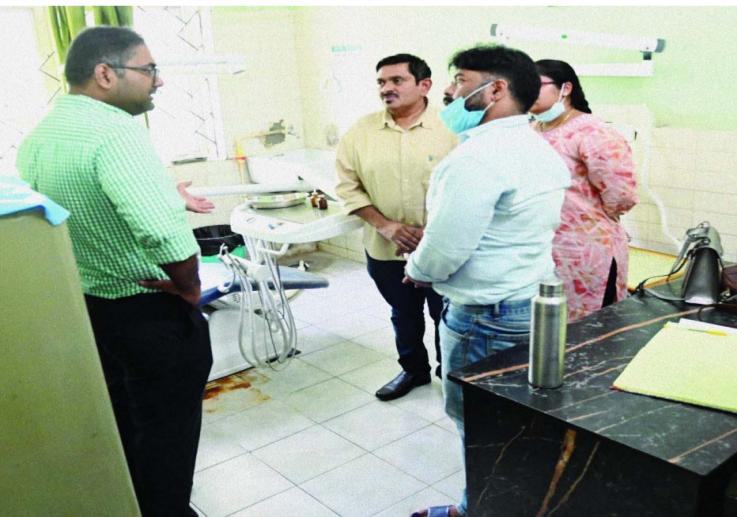
చికిత్స విభాగాన్ని ప్రారంభించి ప్రజలకు అందుబాటులోకి తీసుకురావాలని అధికారులను ఆదేశించారు. ప్రజలకు