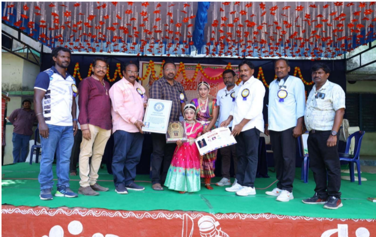
కబడ్డీ ఆడుతున్న క్రీడాకారులు.