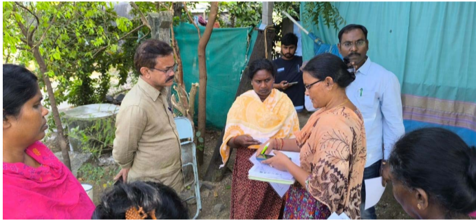
ఓటర్ల సర్వే లో వేగం పెంచాలి..