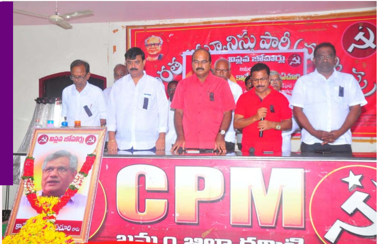
ఖమ్మం, సెప్టెంబర్ 13 (ప్రజా జ్యోతి)