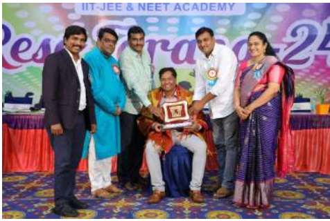
హస్తాంకం, సెప్టెంబర్ 28(ప్రజా జ్యోతి):