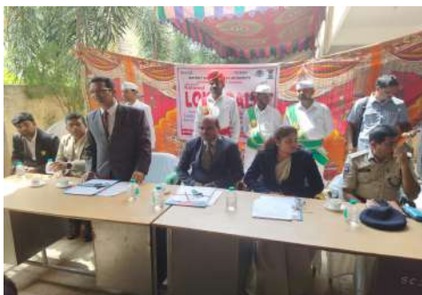
- కేసుల్లో ఇరికి కోర్టు, పోలీస్ స్టేషన్ ల చుట్టూ తిరిగితే సప్టమే తప్ప లాభం ఉండదు

-జిల్లా ప్రధాన న్యాయమూర్తి పి. నారాయణ బాబు .