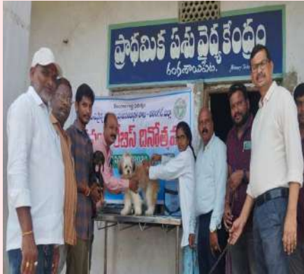
వరంగల్ సీటీ, సెప్టెంబర్ 28 (ప్రజాజ్యోతి):