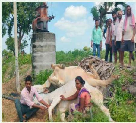
మంపెడ, సెప్టెంబర్ 28 (ప్రజా జ్యోతి) :