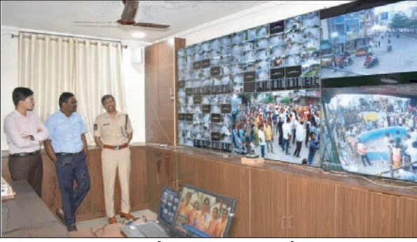
ప్రజా జ్యోతి, నిజామాబాద్ బ్యూరో :