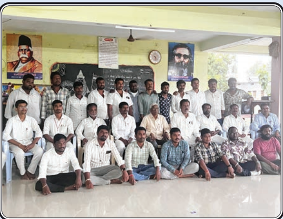
50వేల విలువ చేసే సౌండ్ సిస్టం అందించిన 2008-09 బ్యాచ్ పూర్వ విద్యార్థులు జమ్మికుంట, సెప్టెంబర్ 27, ప్రజాజ్యోతి