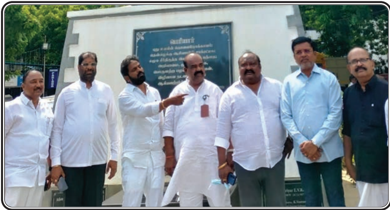
రామగిరి, సెప్టెంబర్ 27, ప్రజాజ్యోతి