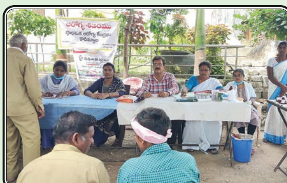
కొడిమ్యాల, సెప్టెంబర్ 27, ప్రజాజ్యోతి