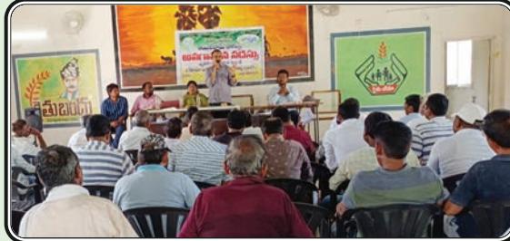
జమ్మికుంట, సెప్టెంబర్ 27, ప్రజాజ్యోతి