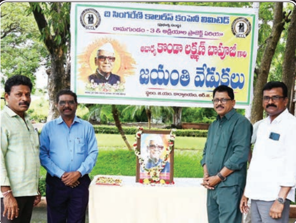
రామగిరి, సెప్టెంబర్ 27, ప్రజాజ్యోతి