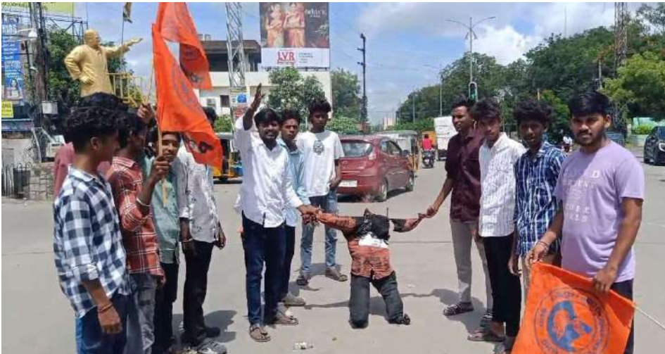
ప్రజాజ్యోతి, నిజామాబాద్ ప్రతినిధి :

అఖిల భారతీయ విద్యార్థి పరిషత్ ఏబీపీఐ ఇండూర్ శాఖ ఆధ్వర్యంలో శనివారం ధర్మా చౌక్ లో డీఈఓ డిప్టి ఐష్విబిమ్మ దహనం చేశారు. ఈ సందర్భంగా ఇండూర్ విభాగ్ కన్వీనర్ కెరి శశిధర్ మాట్లాడుతూ ప్రభుత్వ నిబంధనలకు వ్యతిరేకంగా ఇష్ట రాజ్యాంగ నడుపుతున్న శ్రీ చైతన్య పాఠశాల యొక్క గుర్తింపుని రద్దు చేయాలని, ఇండూర్ జిల్లాలో శ్రీనగర్ కాలనీలో శ్రీ చైతన్య పాఠశాలకి ఎలాంటి పర్మిషన్ లేనప్పటికీ ఉదయం 7:30 నుండి రాత్రి 8:30 వరకు విద్యార్థులను ఇబ్బందులకు గురి చేస్తూ ప్రభుత్వ నిబంధనలకు వ్యతిరేకంగా ఇష్ట రాజ్యాంగ నడిపిస్తూ విద్యార్థుల తల్లిదండ్రుల నుండి