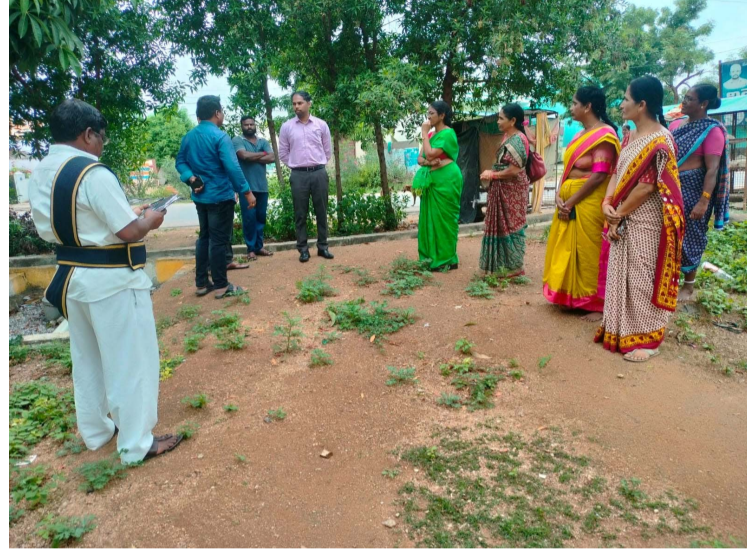
అధికారులకు సూచించారు. గ్రామంలో దోమలను పారద్రోలేందుకు ఫాగింగ్ చేపట్టాలన్నారు. అనంతరం కొడకండ్ల మండలం మొండ్రాయి గ్రామంలో పర్యటించి అంగన్వాడి కేంద్రాన్ని సందర్శించారు. పనులు త్వరితగతిన చేపట్టి పూర్తి చేయాలని సంబంధిత అధికారులను ఆదేశించారు. ఈ కార్యక్రమంలో జిల్లా మహిళా శిశు సంక్షేమ శాఖ అధికారిని జయంతి, అంగన్వాడి సిబ్బంది తదితరులు పాల్గొన్నారు.

పాలకుర్తి / కొడకండ్ల (జనగామ) : ఆగస్టు 30 (ప్రజాజ్యోతి) : అంగన్వాడి కేంద్రాల అప్ గ్రేడేషన్ పనులను నాణ్యతతో చేపట్టాలని జిల్లా అదనపు కలెక్టర్ పింకేష్ కుమార్ అన్నారు. పాలకుర్తి మండలంలోని ధర్దేపల్లి, కొడకండ్ల మండలంలోని మొండ్రాయి గ్రామాలలో శుభ్రం అంగన్వాడి అప్ గ్రేడేషన్ పనులను అదనపు కలెక్టర్ పింకేష్ కుమార్ స్వయంగా సందర్శించి పరిశీలించారు. ఈ సందర్భంగా పనులను నాణ్యతతో చేపట్టాలని అధికారులకు సూచించారు. దర్దేపల్లి గ్రామపంచాయతీ లో ప్రైడే సందర్భంగా డ్రై డే కార్యక్రమం అమలు తీరును మండల స్థాయి అధికారులతో కలిసి సందర్శించి పరిశీలించారు. పరిసరాల్లో చెత్త చెదారం ఎప్పటికప్పుడు తొలగించాలని, లోతట్టు ప్రాంతాలలో నీరు నిలవకుండా చదును చేయాలన్నారు. గ్రామాలలోని పరిసరాల్లోనూ ఇండ్లలోనూ దోమలు గుడ్లు పెట్టకుండా టైర్లు, పాత వస్తువులు, కూలర్లు, కొబ్బరి బోండాలు వంటివి తొలగించేస్తూ నిల్వ ఉన్న నీటిని తొలగించేందుకు చర్యలు తీసుకోవాలని, ప్రతి శుభ్రం చేపడుతున్న డ్రై డే కార్యక్రమ ఉపయోగాన్ని ప్రజలకు వివరిస్తూ అవగాహన పరచి, విస్తృత ప్రచారం చేపట్టాలన్నారు. దోమ లార్వా పెరగకుండా మురుగు కాలువల్లో ఆయిల్ బాల్స్ వేయించాలని