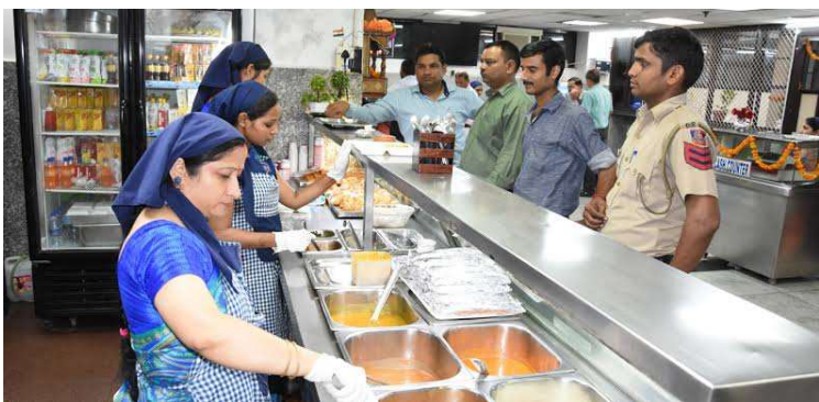
నోటిఫికేషన్ విడుదల చేయకుండా క్యాంటీన్ ను కేటాయిస్తారా...?

మహబూబాబాద్ జిల్లా ప్రతినధి ఆగస్టు 29(ప్రజాజ్యోతి) : తెలంగాణ రాష్ట్రంలో కొత్తగా ఏర్పాటు కాంగ్రెస్ ప్రభుత్వం మహిళలకు చేయూత ఇవ్వాలనే ఉద్దేశంతో మహిళలకు స్వయం సహాయక సంఘాల ద్వారా రుణపరిమితితో మహిళా శక్తి క్యాంటీన్ లను ప్రభుత్వ కార్యాలయాల్లో కేటాయిస్తున్నారు. ఇందుకు గాను మహబూబాబాద్ జిల్లాలో 5 ప్రభుత్వ సంస్థల యందు క్యాంటీన్ లను కేటాయించింది. కానీ వీటికి ఎలాంటి మార్గదర్శకాలు ఇచ్చిన దాఖలాలు కనిపించడం లేదు. ఆ వివరాల కోసం సంబంధిత అధికారిని వివరాల కోసం సంప్రదించగా మండల వ్యాప్తంగా ఉన్న స్వయం సహాయక సంఘాల నుండి ఎవరు ముందుకు వస్తే వారికే కేటాయిస్తామని చెప్పడం గమనార్హం. ఎటువంటి నోటిఫికేషన్ విడుదల