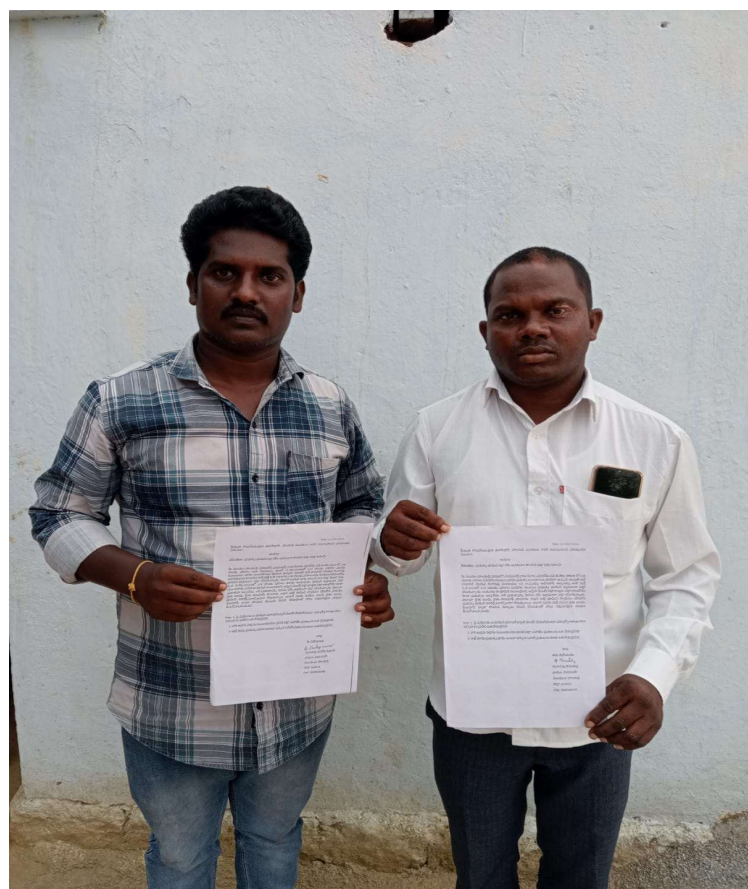
భూమిని పరిరక్షించాలని కోరారు.