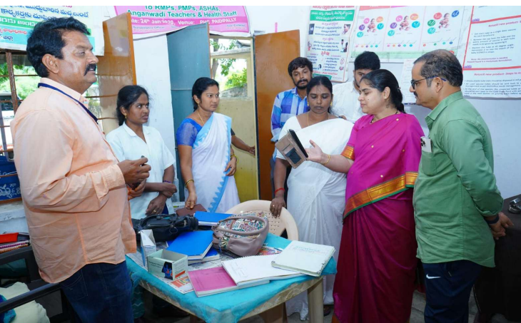
- జిల్లా కలెక్టర్ డాక్టర్ సత్య శారద

జిల్లా కలెక్టర్ డా. సత్య శారదా గురువారం వరంగల్ నగరంలోని పలు పట్టణ ఆరోగ్య కేంద్రాలు, ఆరోగ్య ఉప కేంద్రాలను ఆకస్మికంగా తనిఖీ చేశారు. వరంగల్ నగరంలోని పైడిపల్లి పట్టణ ప్రాథమిక ఆరోగ్య కేంద్రాన్ని, పట్టణ ఆరోగ్య ఉప కేంద్రాన్ని, ఆరేపల్లి పట్టణ ఆరోగ్య ఉప కేంద్రాన్ని ఆకస్మికంగా సందర్శించి అందిస్తున్న వైద్య సేవలపై ఆరా తీశారు. పైడిపల్లి ప్రాథమిక ఆరోగ్య కేంద్రంలో మెడికల్ ఆఫీసర్ అందుబాటులో లేకపోవడంపై కలెక్టర్ ఆగ్రహం వ్యక్తం చేస్తూ తాకిదులు జారీ చేయాల్సిందిగా ఆదేశించారు. యుపీహెచ్సీలో అందిస్తున్న వైద్య సేవలు, అందుబాటులో ఉన్న ఔషధాలు, ఔషధాల జారీ వివరాల రిజిస్టర్ లను పరిశీలించారు. తద్వారా పైడిపల్లి పట్టణ ప్రాథమిక ఆరోగ్య ఉప