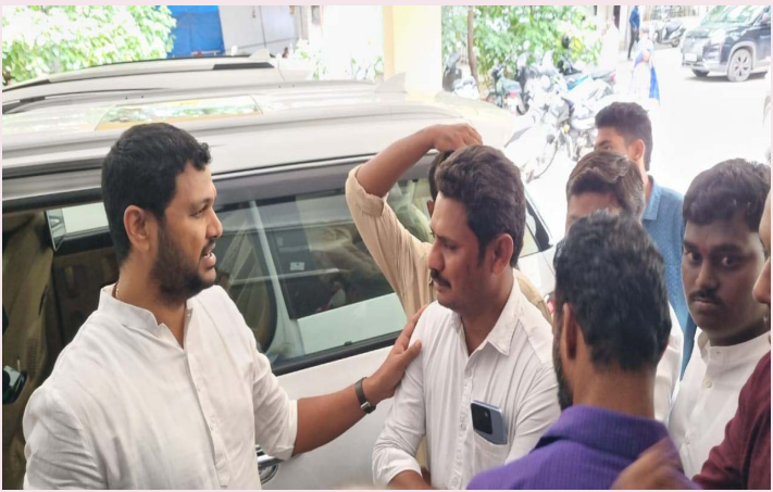
బీసీల అభివృద్ధికోసం పని చేస్తూ