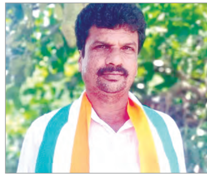
చిరస్థాయిగా నిలిచిపోతుండన్నారు. అసెంబ్లీ సమావేశంలో బడ్జెట్ ప్రవేశపెట్టగానే సుషన్ మొత్తం ఉండకుండా బయటకు వెళ్లిన మాజీ ముఖ్యమంత్రి కేసీఆర్ బడ్జెట్ పై

* కాంగ్రెస్ ప్రభుత్వం రైతు పక్షపాతి * కాంగ్రెస్ పార్టీ అధికార ప్రతినిధి నుంచినకోట కృష్ణ గౌడ్