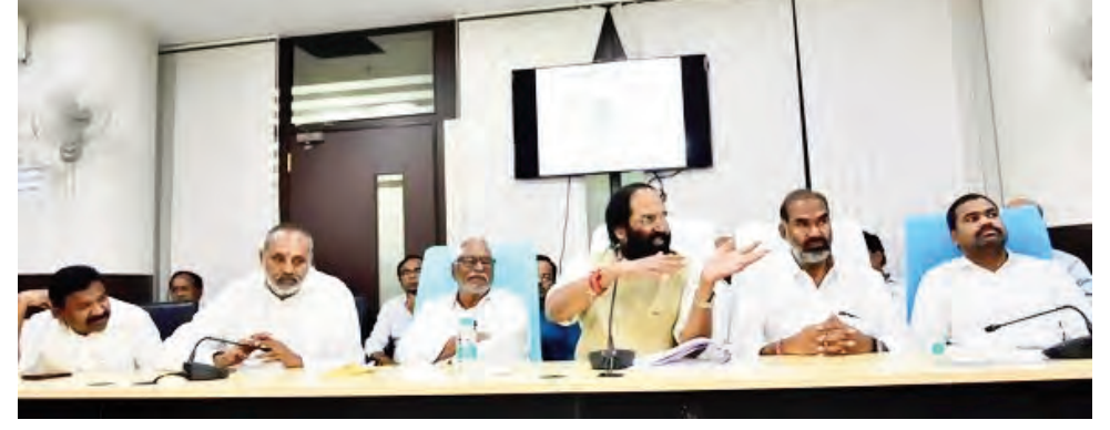
మంత్రి ఉత్తమ్ కుమార్ రెడ్డి ప్రజాభిప్రాయం తెలుసుకోవడానికి కేసీఆర్ ను బద్దం చేస్తామని హెచ్చరించారు. ధరణి సమస్యలకు శాశ్వత పరిష్కారం దిశగా చర్యలు చేపట్టాలని, సవరణలపై కొత్త సమస్యలు తలెత్త కుండా జాగ్రత్తలు తీసుకోవాలన్నారు. సవరణలపై ప్రజాభిప్రాయం పరిగణనలోకి తీసుకోవాలని, మిగతా 12లో..