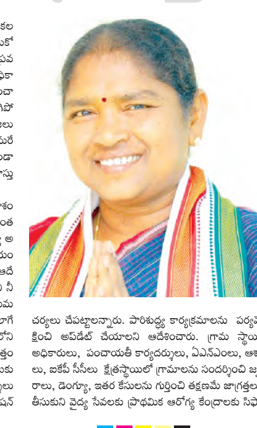
చర్యలు చేపట్టాలన్నారు. పాఠశుద్ధ్య కార్యక్రమాలను పర్యేక్షించి అవినీతి చేయాలని ఆదేశించారు. గ్రామ స్థాయి అధికారులు, పంచాయితీ కార్యదర్శులు, ఎంపీఎంల, ఆశా లు, ఇకపీ సీలెలు క్రైతస్థాయిలో గ్రామాలను సందర్శించి జ్యరాలు, డెంగ్యూ, ఇతర కేసులను గుర్తించి తక్షణమే జాగ్రత్తలు తీసుకుని వైద్య సేవలకు ప్రాథమిక ఆరోగ్య కేంద్రాలకు సిఫా

లకు అందుబాటులో వుంటూ, ఎటువంటి అటంకాలు కలగకుండా తక్షణమే పర్యేక్షించి ముందస్తు చర్యలు తీసుకోవాలని అధికారులకు సూచించారు. అలాగే ఉధృతంగా ప్రవహించే వారుల వద్ద సంకేత బోర్డు లు పెట్టాలన్నారు. అధికారులు 24 గంటలు అందుబాటులో ఉండి సేవలు అందించాలని కోరారు. జిల్లాలో ఎక్కడైనా వరద ఉధృత రోడ్లు తగిలిపోయిన, ఉధృతంగా ప్రవహించేనా అక్కడికి ఆ గ్రామ ప్రజలు వెళ్లవద్దని, రెండు దిక్కులా బారకెడ్లు, ఫ్లాస్క్ కోస్, రైడి మర ఇతర పరికరాలు ఏర్పాటు చేసి ప్రమాదాల భారిన పడకుండా జాగ్రత్త చర్యలు తీసుకుంటు. పోలీస్ బందోబస్తు నిర్వహిస్తున్నారని అన్నారు. వర్షాలకు లోతట్టు ప్రాంతాలు జలమయమయ్యే అవకాశం ఉంటుంది కాబట్టి రోడ్లు రవాణా, విద్యుత్ సరఫరాలో అంతరాయం ఏర్పడి ప్రజలు ఇబ్బందులు పడకుండా రెవెన్యూ అధికారులు విద్యుత్, ఆర్ & బీ శాఖ అధికారుల సమన్వయంతో ముందస్తు జాగ్రత్త చర్యలు తీసుకోవాలి అంటే ఆదేశించారు. జిల్లాలోని చెరువులు, కుంటలు, ప్రోజెక్ట్ లలోని నీటి మట్టాలను ఎప్పుడీ కట్టడు గమనిస్తూ ప్రజలను అప్రమత్తం చేస్తూ చర్యలు చేపడుతున్నామని తెలిపారు. అలాగే గ్రామాల్లో పంచాయితీ సెక్రటరీ లు సైతం తమ పరిధిలోని చెరువుల నీటి మట్టాలను గమనిస్తూ, ప్రజలను అప్రమత్తం చేయాలన్నారు. ప్రజల అత్యవసరం అయితే తప్ప బయటకు వెళ్లొద్దని సూచించారు. గ్రామాల్లో పంచాయితీ కార్యదర్శులు తక్షణమే పాఠశుద్ధ్య కార్యక్రమాలను ప్రారంభించి క్రోవేషన్