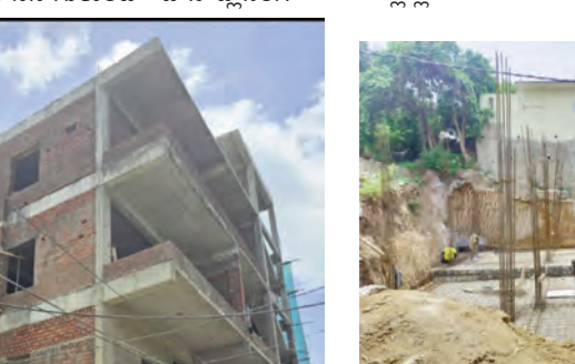
విభాగం అధికారులు ఏం చేస్తున్నారని స్థానికులు ప్రశ్నిస్తున్నారు. ఒక్కొక్క అక్రమ నిర్మాణం నుంచి టౌన్ ప్లానింగ్ అధికారులు లక్షల్లో అమ్మకాలు వసూలు చేస్తుంటారని మల్లాజిరి సర్కిల్ లో తీవ్ర విమర్శలు లు విసపడుతున్నాయి. మోలాలి అగ్రీసీ కాలనీలో కేవలం 120 గజాలలోనే సెల్లార్ నిర్మాణం చేపడుతున్నారు. వివిధ

అక్రమ నిర్మాణాల వద్దకు వచ్చి యజమానులు ఇచ్చే ముదుపులకు అశోపడి వాటిని గాలికి వదిలేస్తున్నారనే ఆరోపణలు ఉన్నాయి. నిరాశంకంగా పుట్టగొడుగుల్లా ఇన్ఫ్రా అక్రమ నిర్మాణాలు కొనసాగుతుంటే టౌన్ ప్లానింగ్