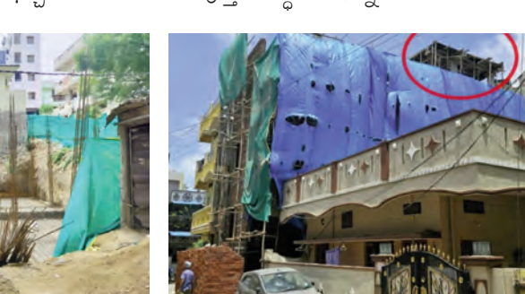
అనుమతులు లేనప్పటికీ కొందరు యథేచ్ఛగా వాటిని నిర్మిస్తున్నారు. వినాయక్ నగర్ డివిజన్ పరిధిలోనే సూర్యనగర్ కాలనీ, మోలాలి అగ్రీసీ కాలనీలలో చేపడుతున్న నిర్మాణం నిబంధనలకు పూర్తి విరుద్ధంగా ఉన్నా ఆరు నెలలగా

కాలనీలలో నిబంధనలకు విరుద్ధంగా వెలుస్తున్న బహుళ అంతస్తులు,వాటిపై అదనంగా మరో పెంటే చౌకే, అలాగే పాత భవనాలపై అదనపు అంతస్తుల నిర్మాణం, సెల్లార్ల తమ కాలనీలలో యథేచ్ఛగా