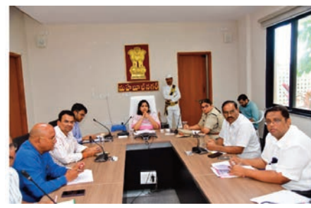
మహబూబ్ నగర్ జూలై 22 (ప్రజా జ్యోతి బ్యూరో)

వర్షాల కురుస్తున్నందున అధికారులు అప్రమత్తంగా ఉండాలని, ప్రజలకు ఎటువంటి ఇబ్బందులు తలెత్తకుండా చర్యలు తీసుకోవాలని జిల్లా కలెక్టర్ వజయేంద్ర బోయి ఆదేశించారు. సోమవారం జిల్లా కలెక్టరేట్ కార్యాలయం లో ఎస్.పి.డి.జానకి తో కలిసి వివిధ శాఖల అధికారులతో సమావేశం నిర్వహించి వర్షాల కారణంగా తీసుకోవలసిన చర్యలపై ఆమె సమీక్షించారు. జిల్లా జనరల్ ఆసుపత్రిలో, పి.హెచ్.సి.లలో జ్వరాల కేసుల పై సమీక్షించారు. ప్రతి రోజూ జనరల్ ఆసుపత్రి లో క్షేత్ర స్థాయిలో రోజు వచ్చే జ్వరాలకు సంబంధించి పాజిటివ్ కేసులను డాక్టర్లు అప్రమత్తంగా అంటూ