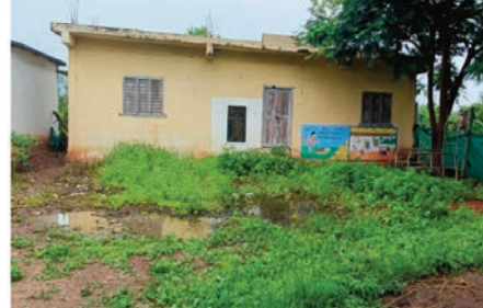
నవాబుపేట్ జూలై 19 (ప్రజా జ్యోతి) పశువైద్యంపై

నిర్లక్ష్యం కొనసాగుతుంది మూగజీవాలే కదా అని బతికిన చచ్చిన ప్రశ్నించేవారెవరు అనే రీతిలో నవాబుపేట మండలం గుబ్బడి ఫత్తేపూర్ గ్రామంలో పశువైద్య సేవలు అందిస్తున్నట్లు గ్రామస్తులు ఆరోపిస్తున్నారు. పశు వైద్యశాలలో డాక్టర్లు కొరత ఉంది, వైద్యులు ఉన్నచోట్ల అందుబాటులో లేని అందుబాటులో లేని పరిస్థితి నెలకొంది. పశు వైద్యశాల ఉన్నప్పటికీ పశువులకు వైద్యం అందించే నాథుడే కరువయ్యాడని గ్రామ ప్రజలు చెప్పుకొస్తున్నారు. మూగజీవాలకు పశువైద్యం గ్రామాలలో అందని డ్రాక్షలా మారింది. పశు వైద్యశాలల్లో సిబ్బంది కొరతతో పాటు సరిపడా వసతులు లేక పశువులకు సరైన వైద్యం అందడం లేదు. వసతులు ఉన్నచోట మాత్రం పశు వైద్యాధికారులు రాకుండా విధుల పట్ల అలసత్వం వహిస్తున్నారని ఆరోపణలు వినిపిస్తున్నాయి. దీంతో మూగజీవాలకు సరైన వైద్యం అందక మృత్యువాత పడుతున్నాయనే తెలుస్తుంది. కొత్తగా ఇటీవలే కొలువు దీరిన కాంగ్రెస్ ప్రభుత్వంపై కోటి ఆశలు పెట్టుకున్నారు. ఈ సారైనా పశుసంవర్ధక శాఖలో ఫోన్లలో భర్తీకి మోక్షం కలగక పోదా అని పాడి రైతులు కోటి ఆశలతో ఎదురు చూస్తున్నారు. దీనితో