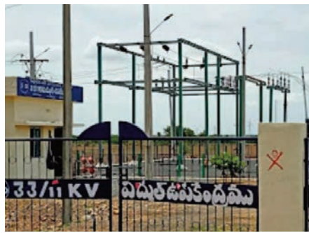
వికారాబాద్ ప్రతినిధి, జూలై 19 (ప్రజా జ్యోతి): నేడు