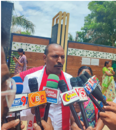
మేడ్చల్ /మల్కాజ్ గిరి జిల్లా, జూలై.16(ప్రజా జ్యోతి) మేడిపల్లి మండలం, బోవప్పల్ మునిసిపల్ కార్పొరేషన్