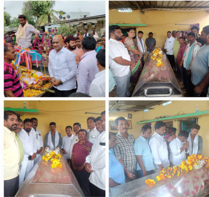
కారేపల్లి జూలై 16 ప్రజా జ్యోతి :