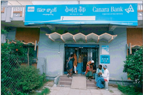
మండల స్థాయి సంబంధిత శాఖల అధికారులు అందుబాటులో ఉండాలని, బ్యాంక్ మేనేజర్లతో పాటు సిబ్బంది సమయపాలన పాటిస్తూ రైతులకు తమ వంతు సేవలను అందించాలని కోరారు.

తెలంగాణ రాష్ట్ర ముఖ్యమంత్రి రేవంత్ రెడ్డి వ్యవసాయ భూమి కలిగి ఉన్న ప్రతిరైతుకు లక్ష రూపాయల రుణమాఫీ చేశారు. ఈ సందర్భంగా రైతులు రుణమాఫీ అయ్యిందా లేదా అని తెలుసుకోవడానికి రైతులు బ్యాంకులకు పరిగెడుతున్నప్పటికీ సమయపాలన పాటించకుండా బ్యాంక్ అధికారులు నిర్లక్ష్యంగా వ్యవహరిస్తున్నారని రైతులు మండిపడుతున్నారు. రుణమాఫీ ప్రకటించినప్పటికీ ఎడపల్లి మండల రైతులు మండల పరిధిలో గల బ్యాంకుల వద్ద బారులు తీరుతున్నారు. సోమవారం ఉదయం బ్యాంకులకు చేరుకున్న రైతులూ అధికారుల కోసం ఎదిరి చూస్తున్నారు. బ్యాంక్ మేనేజర్లు, ఫీల్డ్ ఆఫీసర్లు, క్యాష్ ఇయర్లు, మిగతా బ్యాంక్ సిబ్బంది సమయపాలన పాటించడం లేదని ఆరోపించారు. బ్యాంకులకు వెళ్లిన రైతులు, మహిళా రైతులకు బ్యాంకు సిబ్బంది సరైన సమాధానం చెప్పడం లేదని మహిళా రైతులు ఆవేదన వ్యక్తం చేస్తున్నారు. రైతులను, మహిళా రైతులను పట్టించుకునే నాధుడే కరువయ్యారన్నారు. సంబంధిత బ్యాంక్ అధికారులతో పాటు