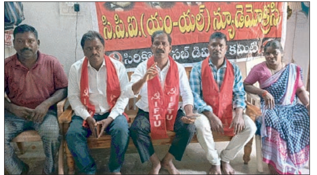
సిరికొండ, జూలై 17 ప్రజా శోభి (ప్రతినిధి):