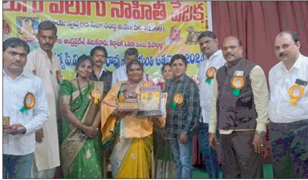
బోధన్,జూన్ 30(ప్రజా జ్యోతి) :

తెలుగు వెలుగు సాహితీ వేదిక జాతీయ స్వచ్ఛంద సేవా సంస్థ ఆధ్వర్యంలో మాజీ భారత ప్రధాని భారతరత్న పివి నరసింహారావు జయంతి ఉత్సవాల