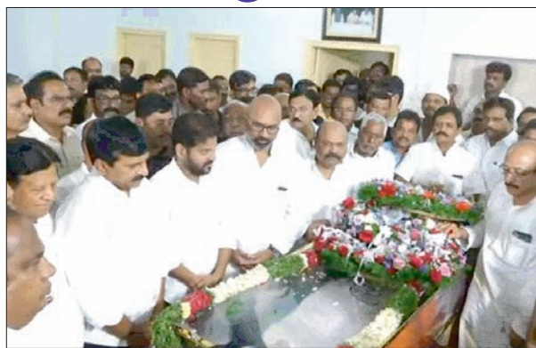
మోర్రాడ్ నిజామాబాద్, జూన్ 30 ప్రజా జ్యోతి ప్రతినిధి

జనసంద్రంగా మాజీ మంత్రి డి.శ్రీనివాస్ అంతిమయాత్ర నివాళు లర్పించిన సీఎం రేవంత్ రెడ్డి ప్రభుత్వ అధికార లాంఛనాలతో అంత్యక్రియలు పర్యవేక్షించిన కలెక్టర్, డి.ఐ.జీ, సి.పి. శ్రద్ధాంజలి ఘటించిన మంత్రులు, ప్రజాప్రతినిధులు తన సుదీర్ఘ రాజకీయ ప్రస్థానంతో జన హృదయ నేతగా పేరొందిన మాజీ మంత్రి డి.శ్రీనివాస్ కు అశ్రునయనాలతో అంతిమ వీడ్కోలు పలికారు.