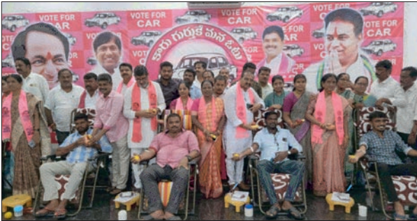
సిరిసిల్ల: జూలై 24 (ప్రజా జ్యోతి)

సిరిసిల్ల పట్టణంలో బిఆర్ఎస్ పార్టీ ఆధ్వర్యంలో సిరిసిల్ల ఎమ్మెల్యే కేటీఆర్ జన్మదిన వేడుకలు అంగరంగ వైభవంగా అంబేద్కర్ చౌరస్తా వద్ద కేక్ కట్ చేసి బద్దే వేడుకలు ఘనంగా నిర్వహించుకోవడం జరిగింది. అలాగే జిల్లా ప్రభుత్వ ప్రధాన ఆసుపత్రిలో రోగులకు పండ్లు పంపిణీ చేశారు. అనంతరం పట్టణంలో గత మూడు రోజుల నుండి వస్త్ర పరిశ్రమలో ఏర్పడిన సంక్షోభం పట్ల నివారణ చర్యలు ప్రభుత్వం చేపట్టాలని అంబేద్కర్ చౌరస్తా వద్ద రిలే నిరాహార దీక్షకు కేటీఆర్ జన్మదినం సందర్భంగా బిఆర్ఎస్ పార్టీ నాయకులు నిరసన తెలిపారు. బిఆర్ఎస్ పార్టీ జిల్లా కార్యాలయం తెలంగాణ భవన్ లో పార్టీ నాయకులు కార్యకర్తలు రక్షదానం చేశారు. కేటీఆర్ జన్మదినం